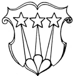
Fig. 27. Glasson.

«Le notaire Joseph Comba, le premier, et ceci vers le début du XIX me siècle, se mit au travail formidable d'un armorial du Canton de Fribourg. Ce travail qu'il faut consulter avec circonspection, est une source extrêmement précieuse vu la quantité énorme d'armoiries paysannes que son auteur a notées. Un premier brouillon (Comba II), auquel Comba travaillait encore en 1828, est déposé à la Bibliothèque cantonale: il contient environ 900 armoi-