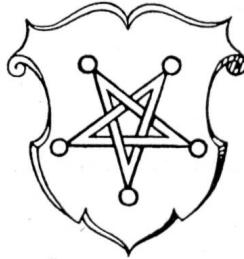
Fig. 29. Gurnel.