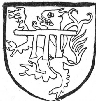
Fig 115. Beaujeu-Forez (Uffenbach)