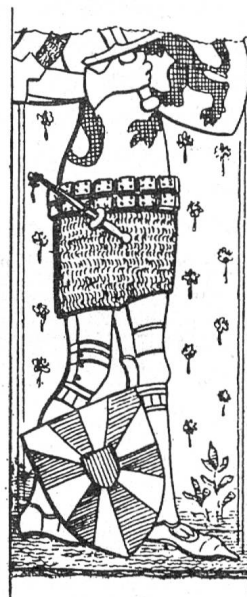
Fig. 110. Philipp v. Elsass (Kortrijk).