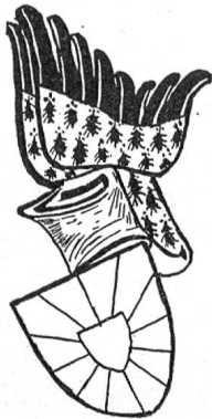
Fig. 111. Alt-Vlandern (Gelre).