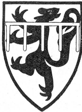
Fig. 112. Beaujeu-Forez (Diana).