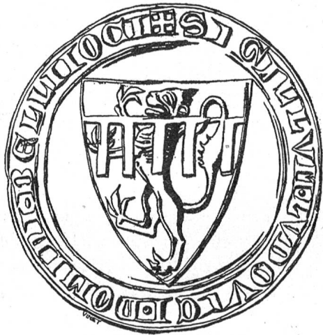
Fig. 109. Ludwig v. Beaujeu-Forez 1283 (Paris, Arch. Nat.).