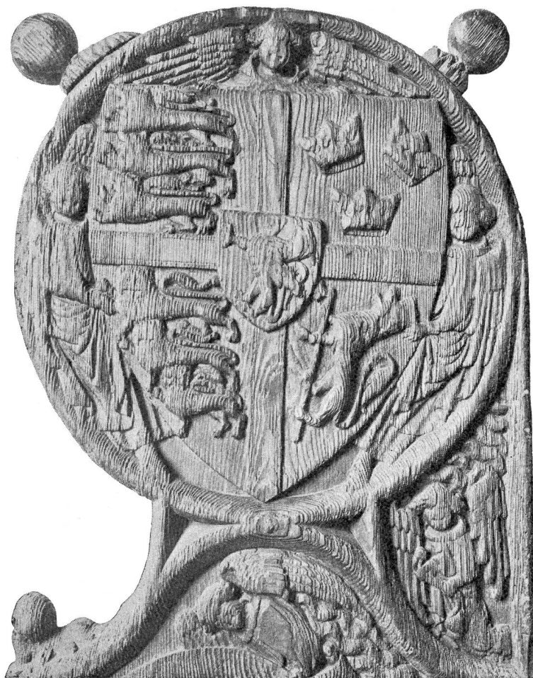
Fig. 1. Armoiries d'Eric de Poméranie.

Le quatrième quartier est coupé d'or, au lion léopardé d'azur au-dessus de neuf cœurs (4, 3, 2), et de gueules au dragon d'or couronné de même. — Ce fut le roi Christian I er qui choisit ce lion (1449) correspondant au titre de Gotorum rex (roi des Goths), employé déjà par Valdemar IV en 1362. Ces armes ont été supprimées