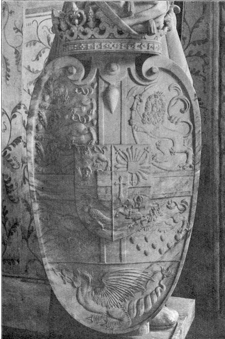
Fig. 4. Armoiries ornant le cénotaphe de Frédéric II.

Comme dans d'autres pays, un écu central, entouré de plusieurs écussons, posés en cercle, a été employé en Danemark, au temps de Christian II,