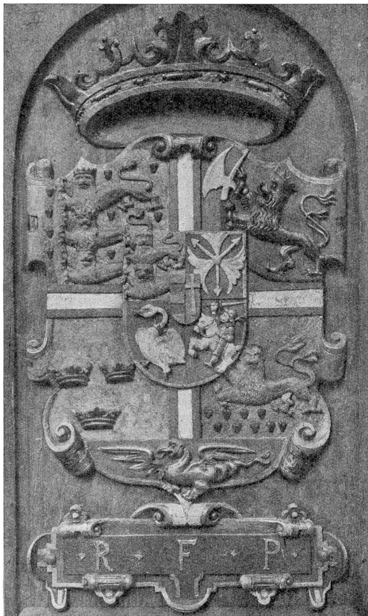
Fig. 3. Armoiries royales de Danemark à l'église de Ste Marie à Helsingoer.

En guise de tenants et de supports, les rois danois du XV e siècle se servaient de différentes figures: deux hommes sauvages, deux lions, un guerrier et un homme sauvage, un ange et un homme sauvage, un lion et une lionne. Sur le sarcophage