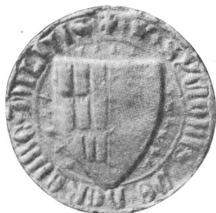
Nr. 1 Siegel von Nr. 4 des Textes (Symon)