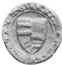
Nr. 2 Siegel von Nr. 7 des Textes (Simon)