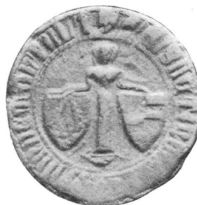
Nr. 3 Siegel von Nr. 9 des Textes (Elisabeth)