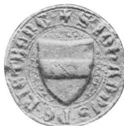
Nr. 2 Siegel von Nr. 4 des Textes (Joh.)