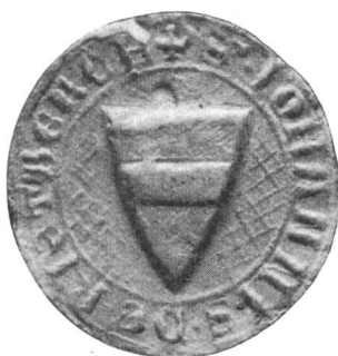
Nr. 1 Siegel von Nr. 4 des Textes (Johann)