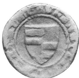
Nr. 1 Siegel von Nr. 6 des Textes (Heinrich)