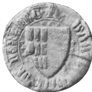
Nr. 2 Siegel von Nr. 5 des Textes (Bartholomäus)