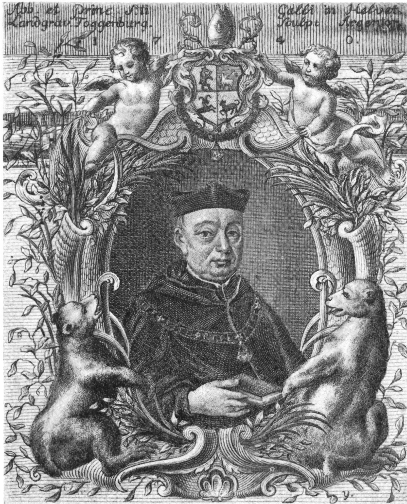
Fig. 55. Porträtexlibris? des Abtes Josef von Rudolfis.

Abt Beda verwendete auch ein kleines Gebrauchsexlibris für seine Bücherei, aus der Hand des Rorschacher Stechers Joh. Fr. Roth, erwähnt bei Gerster Nr. 848 und neuerdings bei Wegmann Nr. 2642, abgebildet in dieser Zeitschrift 1917, pag. 151, fig. 119. Vom gleichen Stecher erwähnt Wegmann einen grossen Stich, 148:191, gedruckt auf gelbe Seide, aus der Stadtbibliothek St. Gallen (Vadiana). Einen Neudruck dieses Stiches birgt auch die Engelberger Exlibris-Sammlung (Fig. 56). Die