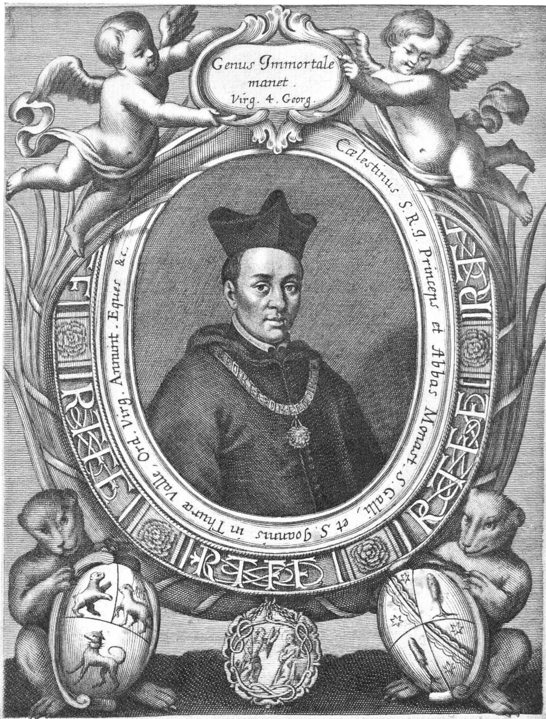
Fig. 53. Porträtstich des Abtes Coelestin Sfondrati.

Ordensschmuck. Es ist umgeben von einer Fülle allegorisch-figürlicher Darstellungen. Oben schwebt in den Wolken der leuchtende Tempel der Weisheit. Zur