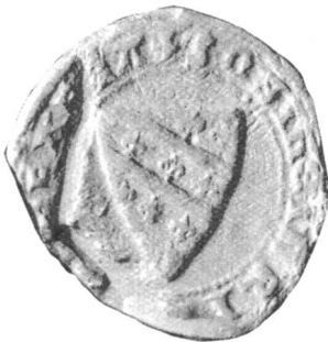
Heinrich III, Ritter 1238/1303 (S. 20)