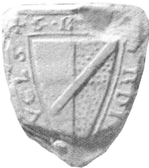
Burkart II 1313 (S. 32)