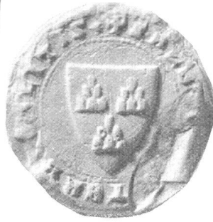
Albrecht I, Ritter 1323 (S. 27)