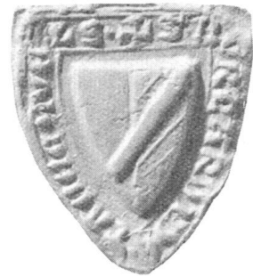
Burkart II, Ritter 1323 (S. 38)