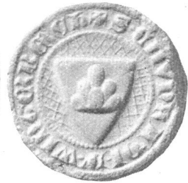
Ritter Chunrad 1313 (S. 27)