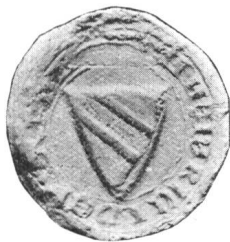
Heinrich III 1278 (S. 36)