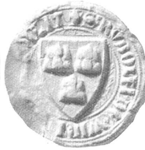
Rudolf III, Ritter 1323 (S. 27)