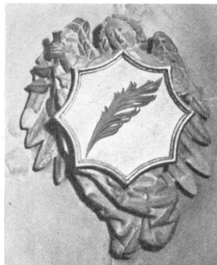
Fig. 41. Wappen des St. Vinzenzstiftes im Berner Münster.