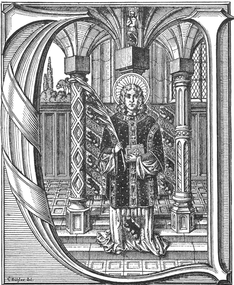
Fig. 42. Die Initiale V mit dem heiligen Vinzenz in einem Berner Antiphonar.