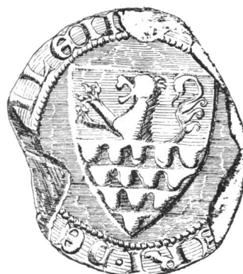
19 3. Siegel von Nr. 14 Walther III. 1308—1310