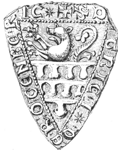
14 2. Siegel von Nr. 12 Dietrich (V.) v. Rotenberg 1270—1272 u. 1278