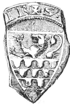
12 3. Siegel von Nr. 9 Otto. 1303