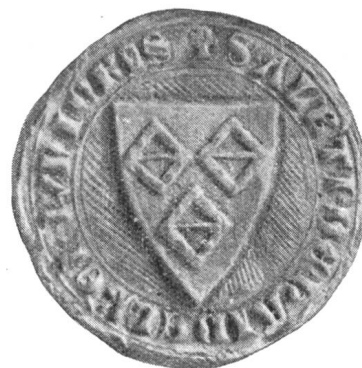
6. Albrecht v. Heidelberg junior 1328.