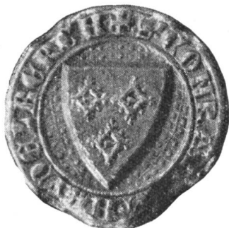
7. Ritter Konrad v. Heidelberg 1326.