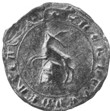
5. Marschalk Herdegen v. Blidegg 1338.