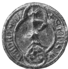
15. Junker Johann v. H. 1400.