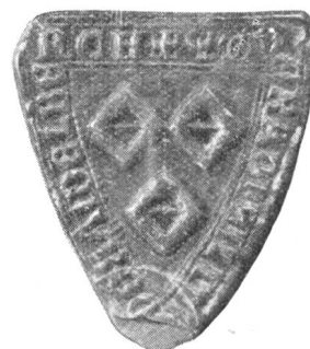
3. Ritter Konrad v. Heidelberg 1300.