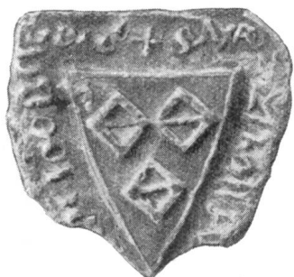
4. Marschalk Wetzel v. Blidegg 1307.