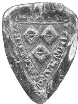
1. Marschalk Wetzel v. Blidegg 1275.