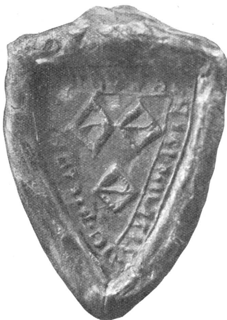
2. Ritter Ulrich v. Heidelberg 1275.