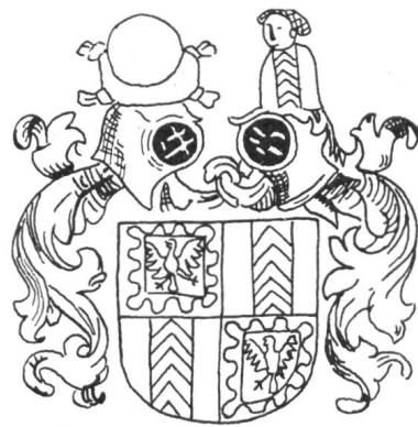
Fig. 62. Varenne de Neuchâtel, comtesse de Fribourg. Chronique de Stumpf, 1548.