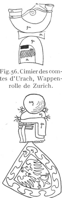
Fig. 57. Fribourg, Tom d'Erstfelden (Uri) début XIVe siècle.