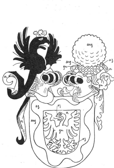
Fig. 58. Le comte de Fribourg. Armorial de Grünenberg. 1483.

L'armorial de Grünenberg 4) qui est d'un dessin splendide, mais ne manque pas d'une certaine fantaisie, en particulier pour les cimiers, attribue au comte de Fribourg deux cimiers: une aigle issante de sable, et la boule reposant cette fois sur un coussin de toile blanche quadrillée de bleu (fig. 58). Cette aigle, qui se trouve