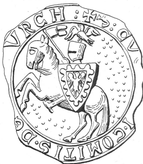
Fig. 59. Sceau de Conrad I de Fribourg, 1248.

déjà sur les plus anciens sceaux des comtes de Fribourg (fig. 59) 5) pourrait être aussi un héritage des ducs de Zähringen dont elle fut peut-être le cimier.