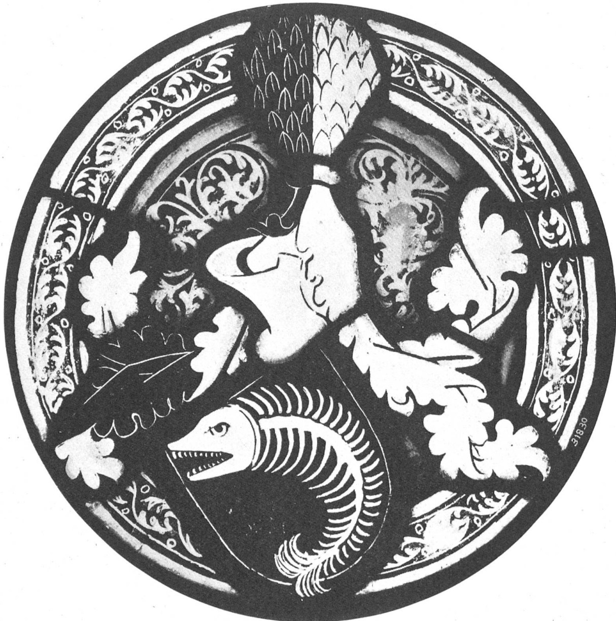
Fig. 107. Vitrail aux armoiries de Praroman.

Le Musée national à Zurich a fait l'acquisition en 1936 d'un petit vitrail rond aux armes de Praroman famille qui a joué un rôle important dans l'histoire de