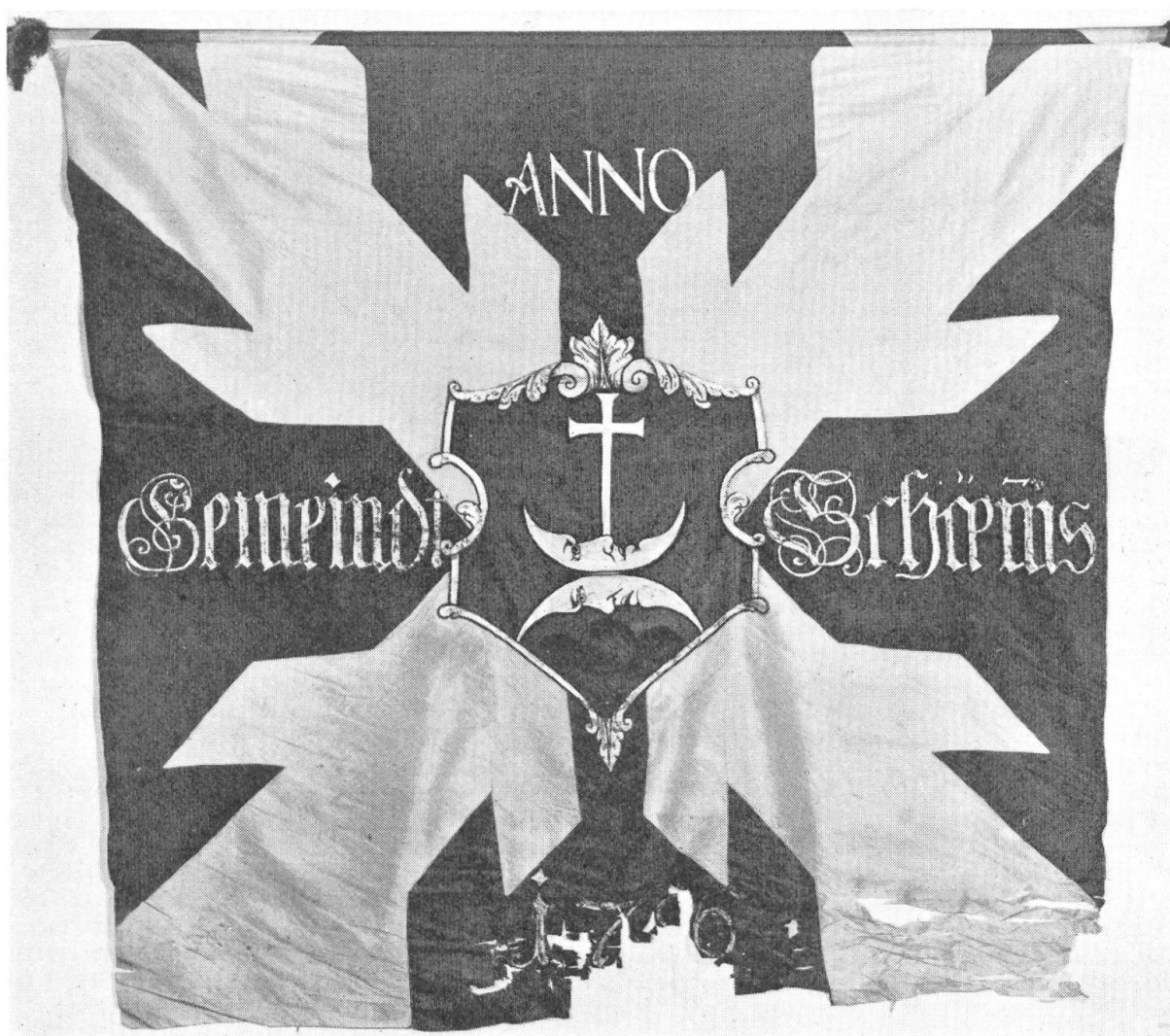
Fig. 49. Gemeindefahne von Schänis. 1786.

Das Tuch ist aus weissem Seidentaffet zusammengesetzt und weist ein Fahnenbild analog der Landesfahne auf. Im Eckquartier in hochrechteckiger vergoldeter Muschelwerk-