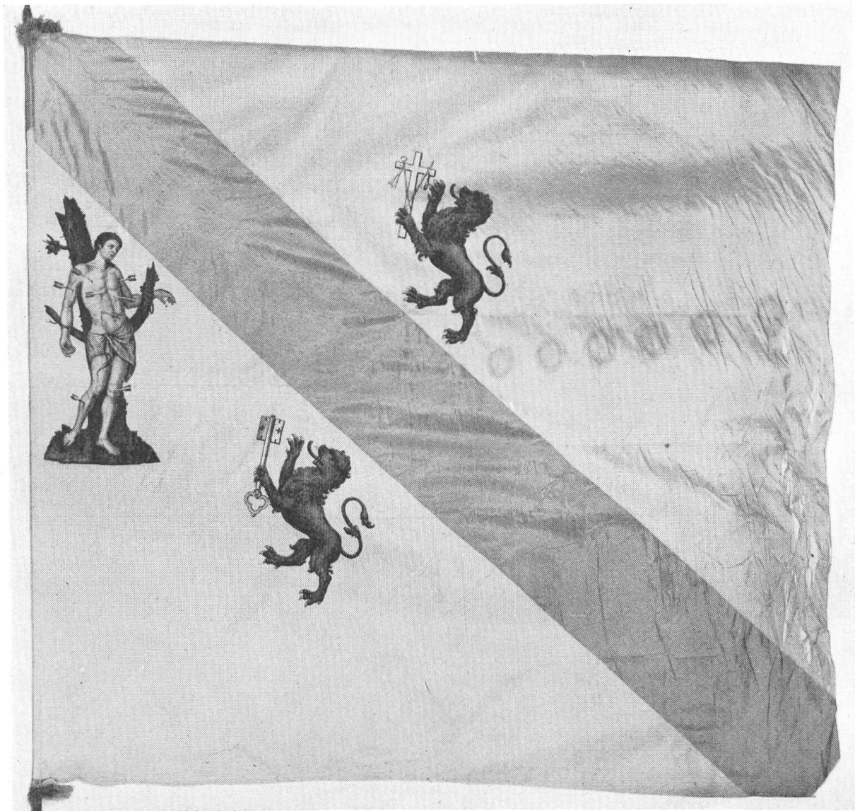
Fig. 48. Landesfahne von Gaster. 2. Hälfte des 18. Jahrhunderts.

Hier mag noch eingefügt werden, dass vor kurzem in st. gallischem Privatbesitz drei Fahnen gefunden wurden, die wir hier im Bilde als Ergänzung des st. gallischen Fahnenbuches wiedergeben können. Es sind dies die Landesfahne von Gaster aus der zweiten Hälfte