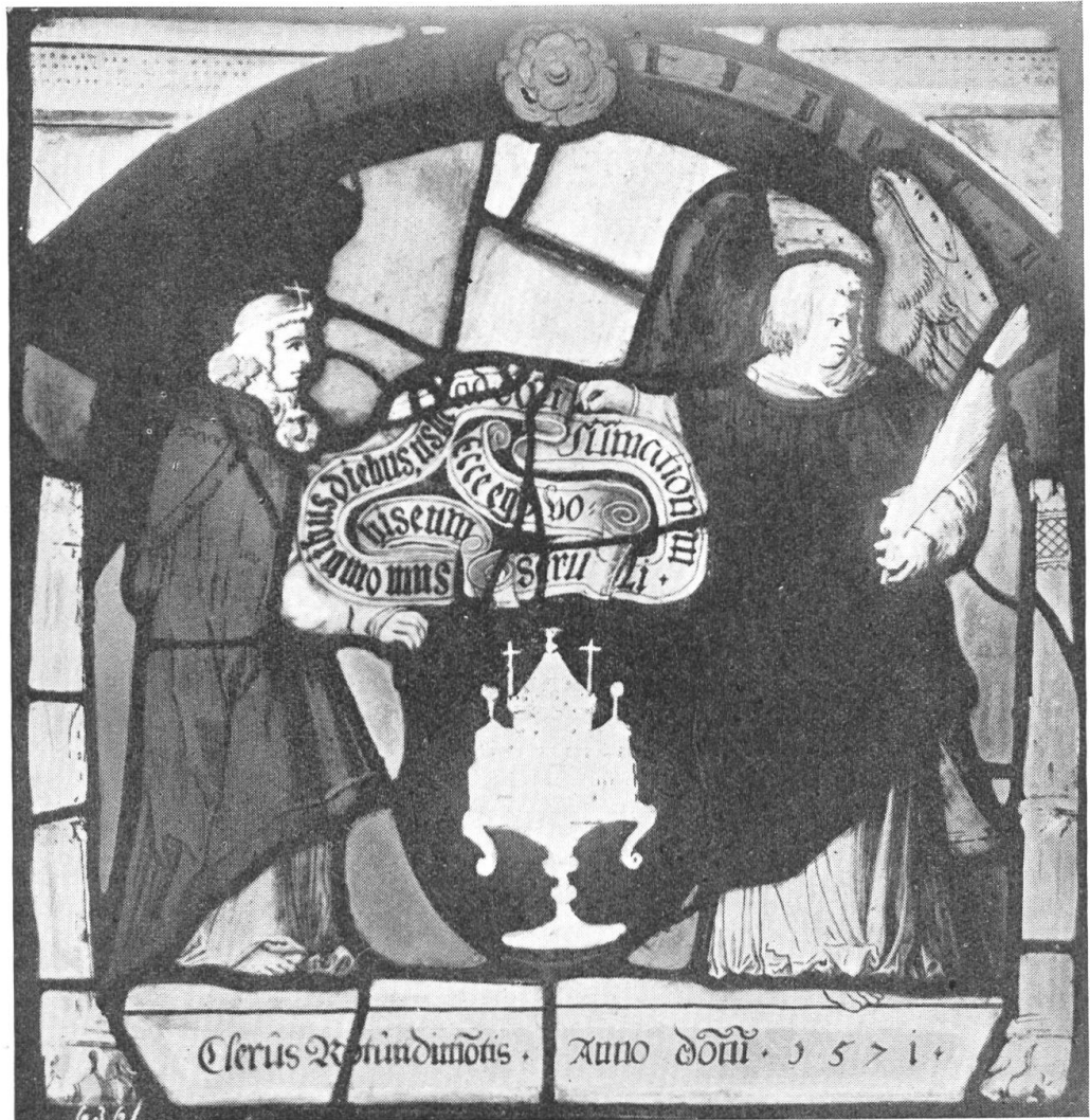
Fig. 74. Armoiries du Chapitre de Romont. Vitrail de 1571 au Musée de Fribourg.

Le Musée de Fribourg possède un très beau vitrail exécuté en 1571. Sous une arcade soutenue par deux pilastres deux anges servent de tenants aux armes du Chapitre de Romont, l'un des anges, vu de profil, tient d'une main l'écu, tandis que l'autre vu de face tient au-dessus de l'écu une longue banderole portant l'inscription: Ecce ego vobiscum sum omnibus diebus usque ad consummationem seculi 2 ) (fig. 74).