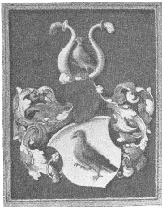
Fig. 76. Wappen aus der Copie des Wappenbriefes von Schobinger 1531.