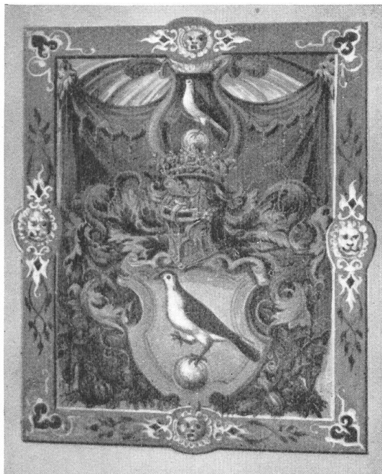
Fig. 79. Wappen der v. Schobinger a. d. Copie des Wappenbriefes 1560 in A. Naef, Burgenwerk.

v. Schobinger, 1560. Kaiser Ferdinand I. bestätigt am 23. Juli 1560 zu Wien den Vettern Bartholome, Joseph und Heinrich Schobinger ihr altes Wappen mit der Verbesserung, dass die Turteltauben im Schild und Kleinod mit dem linken Fuss auf einer silbernen Kugel stehen sollen, und mit der Vermehrung einer goldenen Krone auf dem Schild. Dazu wird die Lehensfähigkeit verliehen.