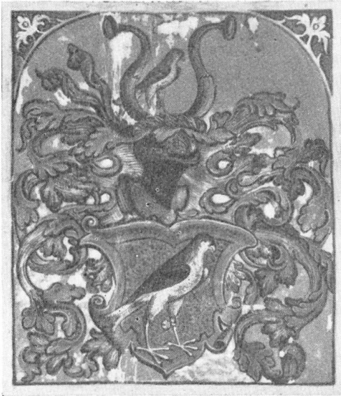
Fig. 77. Wappen aus der Copie des Wappenbriefes Rothmund 1622.

CAROLVS : JMPERATOR : SEP : AVG : HISPANIA RX : VTRI : SICILIE ZCX : REX : ARCHIDVX : AVST :