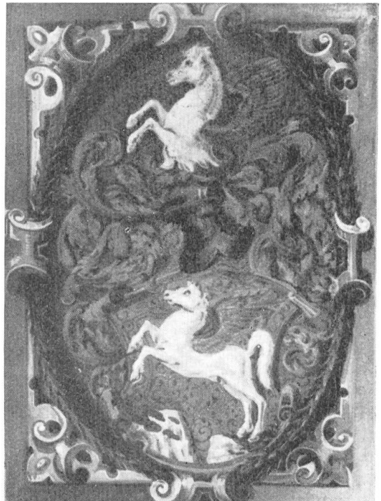
Fig. 80. Wappen aus dem Wappenbrief Kessler 1566.

Literatur: HBLS; Bürgerbuch St. G. 1930; Naef, Burgenwerk.