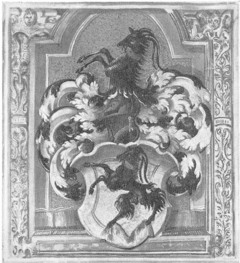
Fig. 78. Wappen aus dem Wappenbrief von Fels 1557.

Literatur: HBLS; S. G. B.; Hausbuch Jkr. Heinrich Fels im Familienarch.; S.H.Arch. 1935.