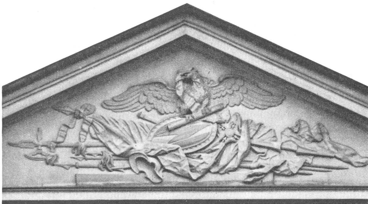
Fig. 61. Wappen des Albrecht Friedrich von Erlach, am Erlacherhof an der Junkerngasse, Bern, um 1750

Das Wappen dieses ehemaligen Ministerialengeschlechtes der Grafen von Neuenburg, das seit 1270 in Bern nachweisbar ist und daselbst eine hervorragende Stellung einnahm, ist ein Bestandteil desjenigen ihrer Lehensherrn, nämlich in Rot ein silberner Pfahl, belegt mit einem schwarzen Sparren. In dem von Kaiser Franz I. an Hieronymus von Erlach anlässlich seiner 1745 erfolgten Erhebung in den erblichen Reichsgrafenstand erteilten Diplom wurde das ursprüngliche Wappen beibehalten, jedoch mit fünf Helmen überhöht. Die Helmzier, deren sich die Familie