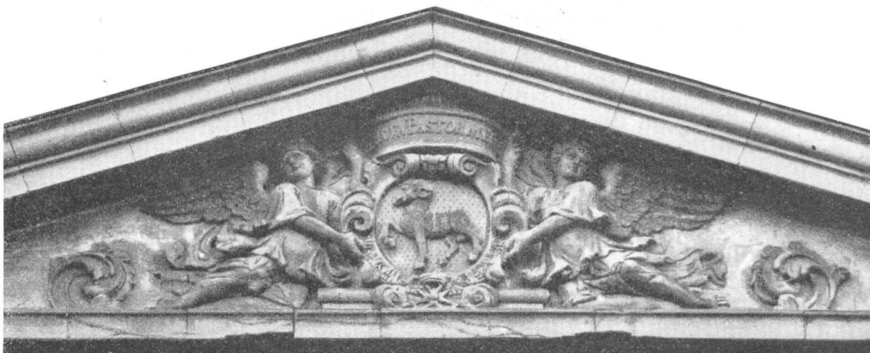
Fig. 62. Wappen des Samuel Frisching, um 1705. Junkerngasse, Bern

Die Familie Marcuard hatte 1543 das Bürgerrecht von Payerne erhalten. Im Jahre 1745 zog der Vater des Obgenannten, Johann Rudolf, 1722—1795, nach Bern und wurde der Gründer des angesehenen bernischen Bankhauses, welches seinen Namen trug. Er wurde 1772 von Kaiser Joseph II. in den Reichsritterstand erhoben. Das Wappen ist in Blau zwei silberne Gemshörner auf grünem Dreieck, begleitet von drei goldenen Sternen, die Helmzier ein wachsender silberner Schwan.