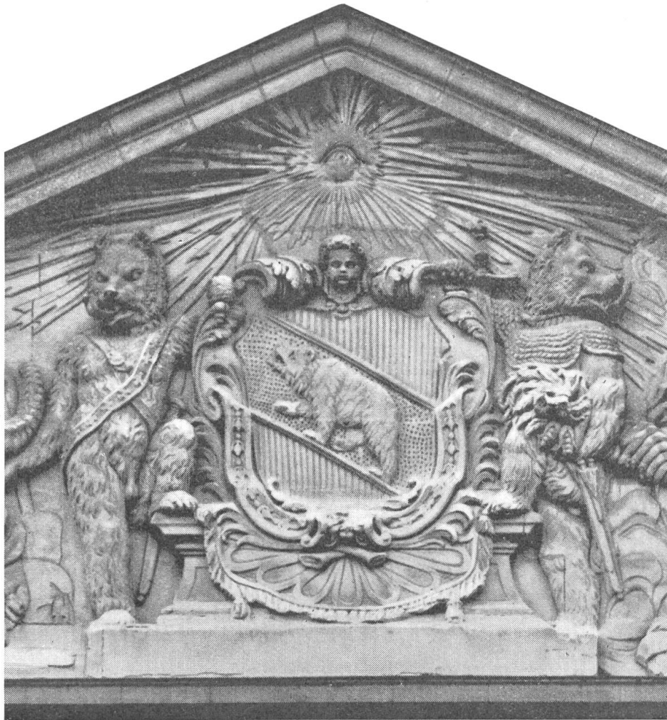
Fig. 63. Detail des Standes-Wappen Berns am Kornhaus