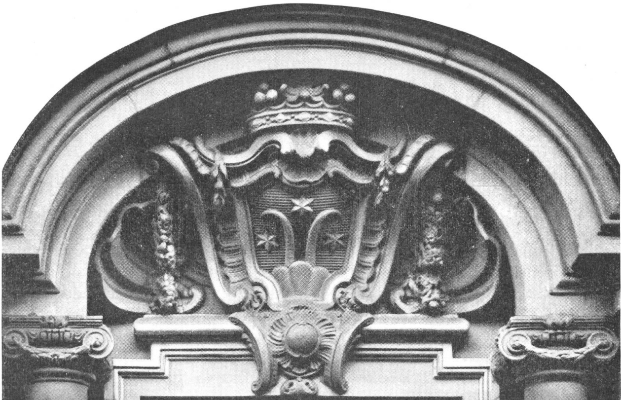
Fig. 57. Wappen des Jakob Rudolf Marcuard, 1764 und 1792. Amthausgasse, Bern

unterbrechenden Dreieck- oder Segmentgiebel gekrönt. Die Giebelfelder tragen als bildhauerischen Schmuck in den meisten Fällen das Wappen des Erbauers oder späteren Besitzers und bei den öffentlichen Bauten das Wappen der „souveränen