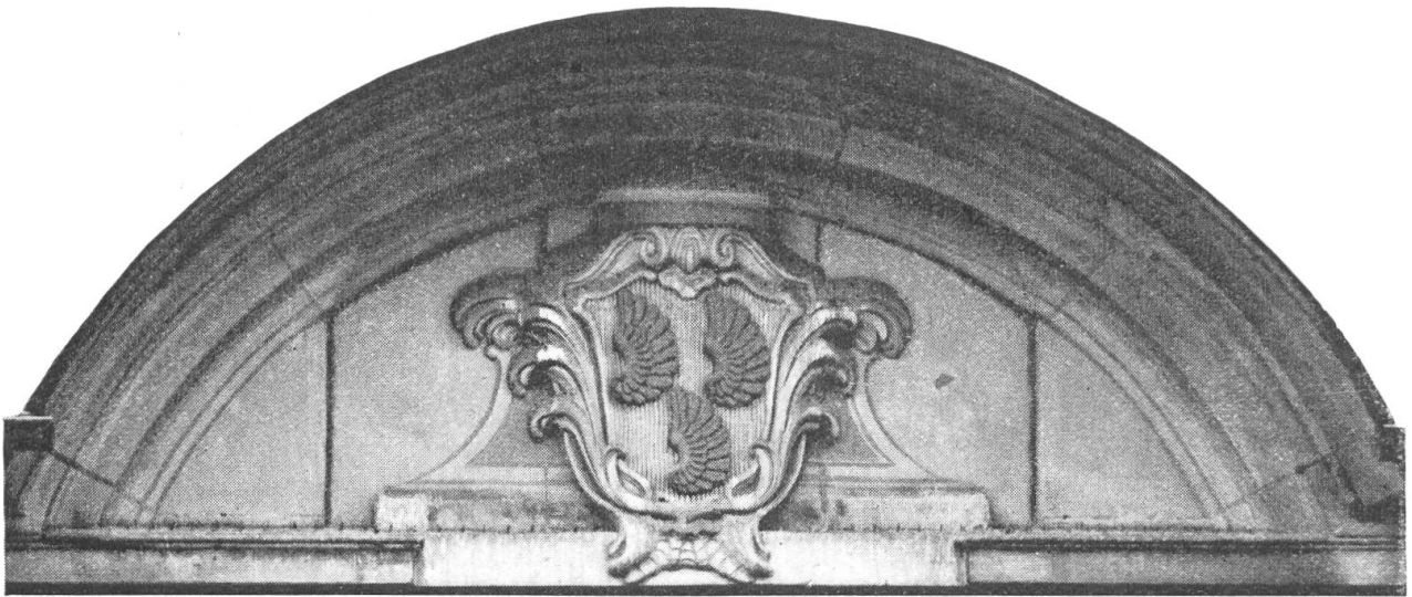
Fig. 60. Wappen des David Salomon von Wattenwyl, 1762, an der Herrengasse, Bern

Die um 1400 in Bern als Bürger aufgenommene Familie gehörte zu den sechs adeligen Geschlechtern, die seit 1651 den Ehrenvorsitz im Kleinen Rat beanspruchten. Das heute geltende Wappen , in rotem Felde drei silberne Flügel, geht zurück auf einen vom 18. Oktober 1453 datierten kaiserlichen Wappenbrief. Das ältere Wappen bestand aus zwei in der Mitte des Schildes nebeneinander gestellten Sparren, und in den ältesten Urkunden siegelt 1295 der nachmalige Johanniter zu Buchsee, Johann, mit einer Rose im Dreieckschild.