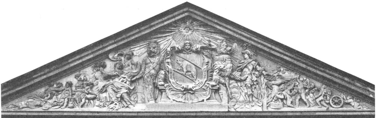
Fig. 56. Wappen des Standes Bern am Kornhaus, um 1716. Kornhausplatz, Bern

Die Mittelachse der palastartig gegliederten Fassaden ist gewöhnlich mit einem den regelmässigen Rhythmus der gleichmässig vorspringenden „Vogeldielen“