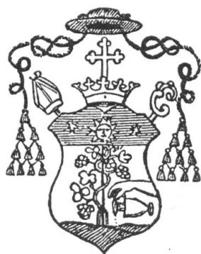
Fig. 86. Armoiries de Mgr Adrien Jardinier, évêque de Sion 1875—1901 ✓