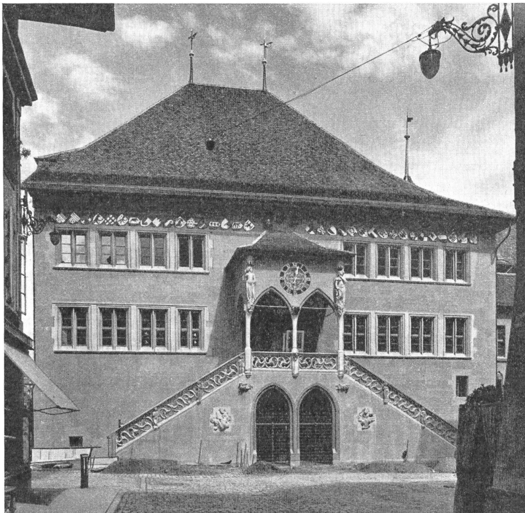
Fig. 55. Das Berner Rathaus nach der Renovation von 1940/42. Unter dem Dachgesims erkennt man deutlich den farbigen Wappenfries mit den Schildern der Amtsbezirke.

Im Herbst 1942 wurde der Umbau des Berner Rathauses, der mehr als zwei Jahre in Anspruch nahm, vollendet, und am 31. Oktober festlich eröffnet. Es lohnt