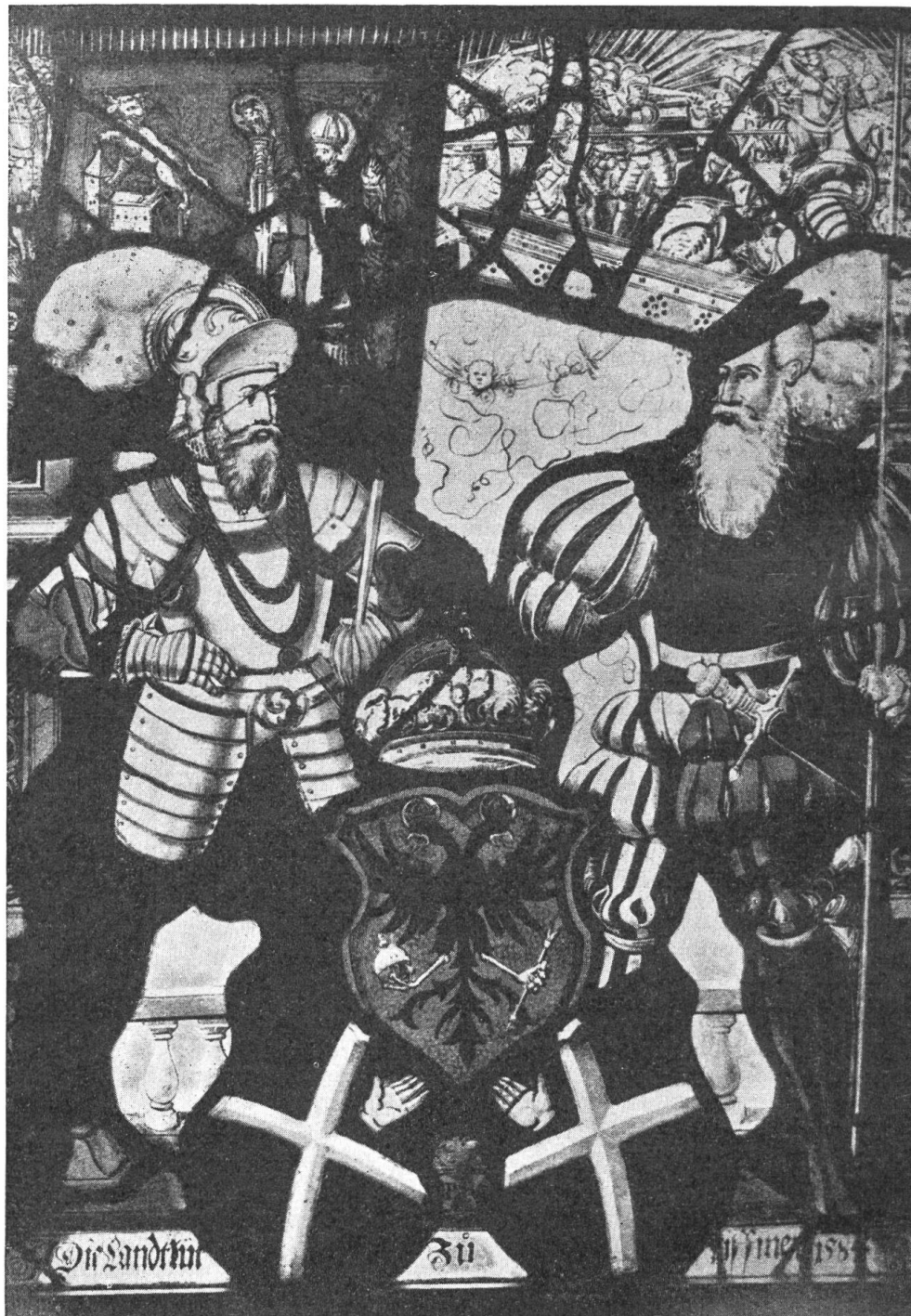
Fig. 94. Wappenscheibe der Leventina von 1584

Das Panner gibt wieder ein anderes Bild. Es findet sich erstmals auf einem Holbeinschen Scheibenriss und zeigt links den stehenden hl. Ambrosius und rechts eine Kirche,