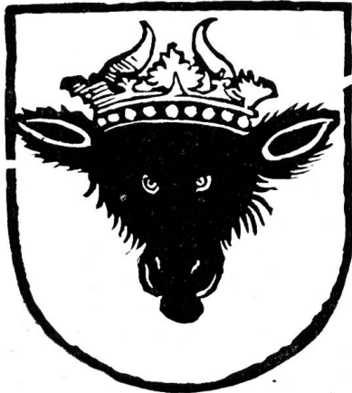
Fig. 64. Der gekrönte Stier von Uri.