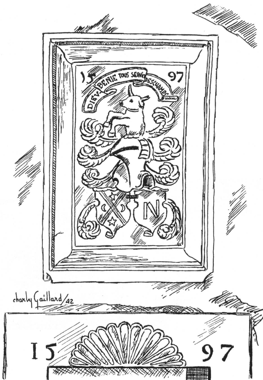
Fig. 53. Armoiries Deschamps-d'Aubonne, à Nyon.

Nous devons à la plume de M. Charly Gaillard le dessin d'une pierre sculptée existant à Nyon, que nous reproduisons ici (fig. 53). Datée de 1597, elle montre