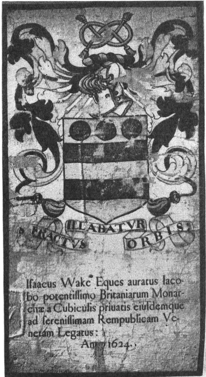
Fig. 4. Placard aux armes de Sir Isaac Wake. Musée Rhétique, Coire.

2. Oliver Flemming . * Arrivé à Genève le 22 mars 1626, trois jours plus tard à Berne, où il se rendit chez l'avoyer, et à Bâle le 28 mars. Ses instr. comme agent auprès des cantons suisses, avec rés. à Zurich, sont datées du 23 août 1629. Arrivé à Bâle le 2 novembre 1629 (il y présenta L. cr. le lendemain), à Zurich le 7, à Berne le 16 et à Genève le 25 novembre, il revint à Zurich le 4 décembre. Il fut fait chevalier pendant un séjour qu'il fit en Angleterre en 1639 et reçut le 3 septembre de nouvelles instr. adressées à « Sir Oliver Flemming chevalier 2) , qui retourne en Suisse