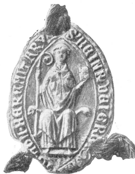
6. Heinrich II. von Güttingen, 1282.