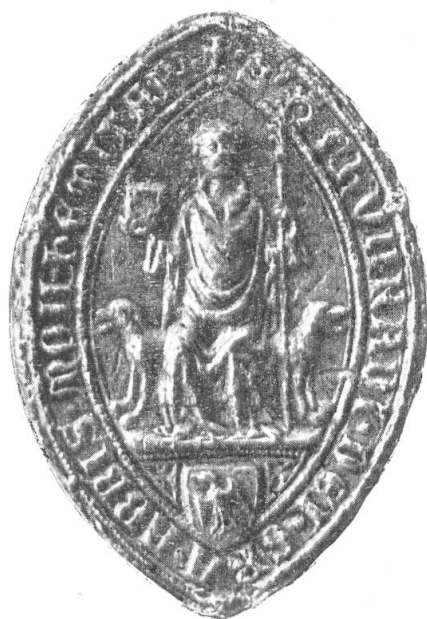
4. Konrad II. von Gösgen, 1347.