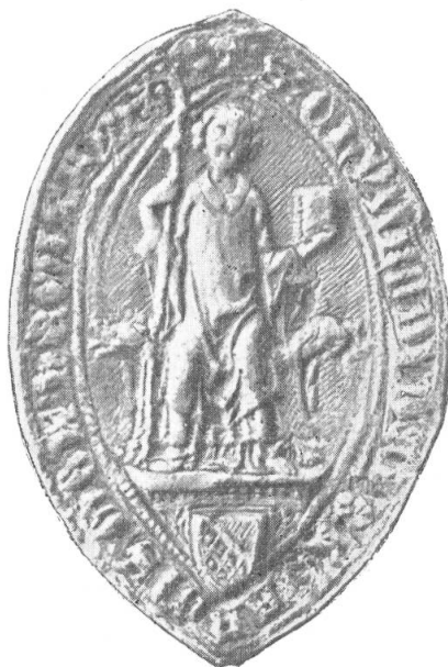
3. Konrad II. von Gösgen, 1334/1347.