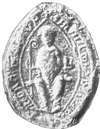
3. Anselm von Schwanden, 1243.