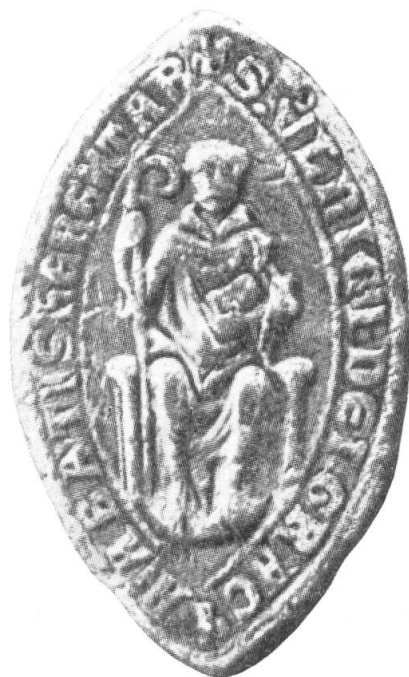
5. Ulrich II., 12...