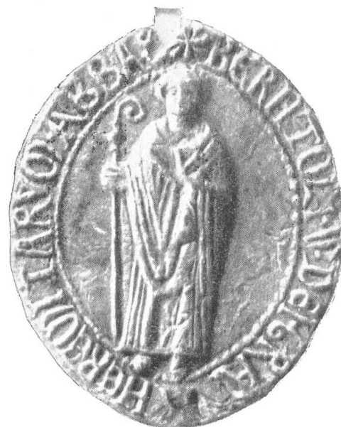
2. Bertold, 1210.