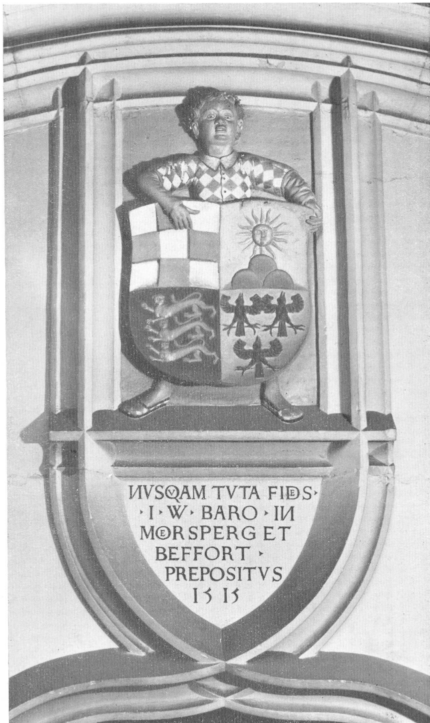
Wappen des Dompropstes Johann Wernher von Moersberg-Belfort, von der früheren Dompropstei zu Basel, 1515.