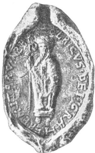
1. Ulrich I. von Rapperswil, 1194.