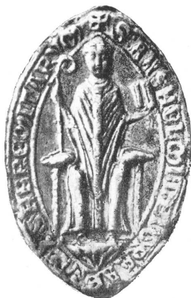
4. Anselm von Schwanden, c. 1239.