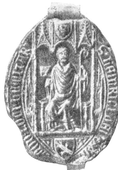
5. Heinrich III. von Brandis, 1348/1357.