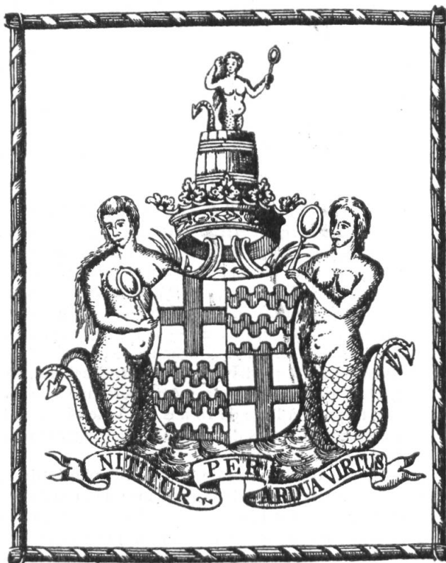
Fig. 55. Ex-libris d'A. L. de Saint-Georges, comte de Marsay.