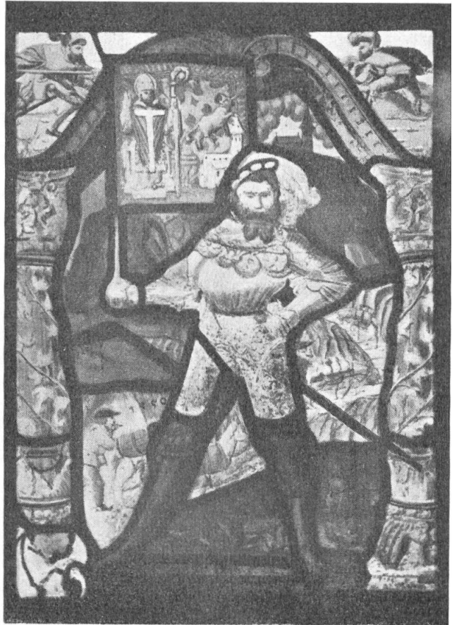
Fig. 61. Pannerträgerscheibe des Livinentals, 1550.