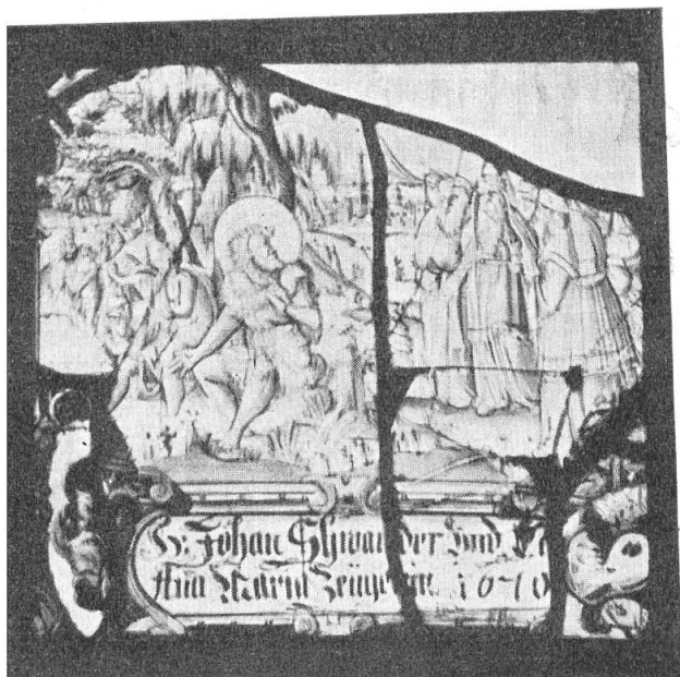
Fig. 66. Scheibe des J. Schwander, 1670.

Links das Steinegger-Wappen : in bl. ein w. Ziegenbock mit g. Hörnern ; Helmzier : wachsender w. Bock mit g. Hörnern. Rechts das Hegner-Wappen : in bl. ein g. Löwe mit einem schw. Hauszeichen in den Tatzen ; Helmzier : wachsender g.-bl. gespaltener, gekleideter Jünglingsrumpf mit dem schw. Hauszeichen belegt. Das Bild zwischen den Rahmensäulen stellt die Anbetung der Hirten dar ; in dem Wolkenkranz ein Engel mit Schriftrolle « Gloria in Excelsis » (Fig. 65).