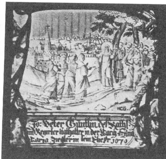
Fig. 64. Scheibe des J. P. Guntlin, 1670.

Die folgenden vier Stücke, alles Grisaille-Arbeiten des Wiler Glasmalers Hans-Caspar Gallati 2) aus dem Jahr 1670 gehören wohl einer gemeinsamen Stiftung von Ehepaaren aus dem schwyzerischen Bezirk March an. In den Dimensionen und in der Komposition scheinen allerdings nur je zwei einander gleich zu sein. Aber bei genauerer Betrachtung sieht man, dass die beiden schmälern Stücke (Nrn. 15 und 17) auf beiden Seiten beschnitten sind, sodass die das Bild einrahmende Säulenarchitektur weggefallen ist und die von einem ovalen Blattkranz umgebenen, die Stifterinschrift flankierenden Wappen nur verstümmelt zu sehen und darum auch von N. E. Toke nicht beschrieben sind.