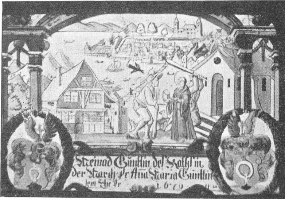
Fig. 67. Scheibe des M. Guntlin, 1670.

18. (Südf. No. 8) 17 : 25 cm. Signiert HCG. Inschrift :