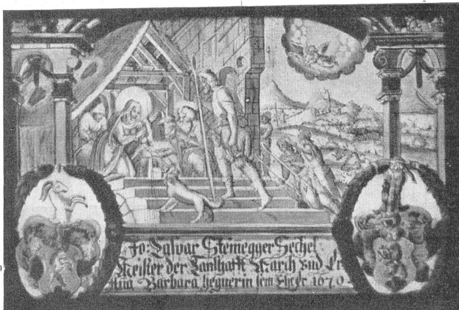
Fig. 65. Scheibe des J. C. Steinegger, 1670.

15. (Südf. No. 2) 19 : 18 cm. Signiert HCG. Die Inschrift mit den eigenartig verschnörkelten Buchstaben lautet :