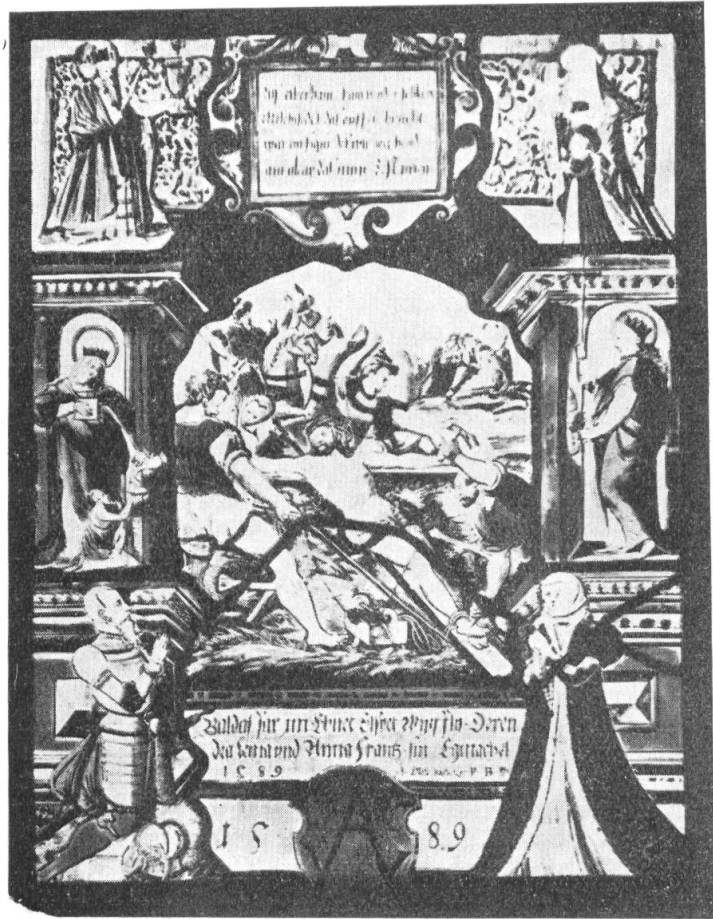
Fig. 63. Scheibe des Balthasar Imebnet, von Bürglen, 1589.

Heiliger Engel vnd Verkünder Bitt du Gott für mich armen Sünder, Das er mein Sünd mir wöl vergeben, Nach disem gen das ewig Leben 4) .