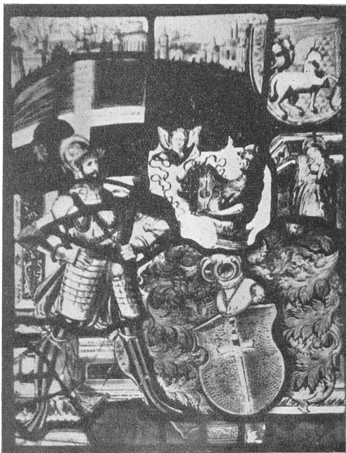
Fig. 62. Pannerträgerscheibe des P. Gisler, von Bürglen.

Die fünf Nrn. 7-11 stammen alle von ernerischen Stiftern aus dem Jahre 1589. Drei davon tragen die Meistersignatur PB des Glasmalers Peter Bock von Altdorf. Leider sind von dreien dieser Glasgemälde keine Photographien vorhanden. Es ist anzunehmen, dass auch die nicht signierten Scheiben vom gleichen Meister gemacht sind, und dass alle Scheiben von 1589 von einer gemeinsamen Stiftung herrühren und aus dem gleichen Hause kommen.