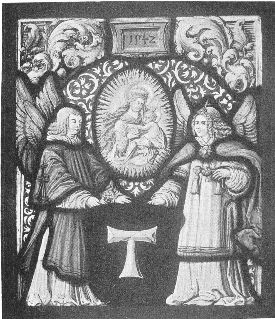
Fig. 72. Vitrail aux armes de l'Hôpital de Romont. Musée du Palais St-Pierre, à Lyon.

écrivain en 1529 à son frère Robert, lui glisse un billet avec « les noms de nos amis », six noms parmi lesquels Wilhelm Zesoz , et il ajouta, « aux quels seroit besoin de faire quelque présent, desquels verrez les noms, de damas ou de velours comme vous semblera » 1) . Après la conclusion du traité de 1525, Porral écrit à Jean