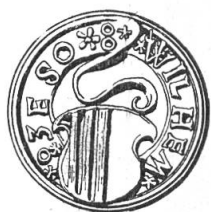
Fig. 69. Sceau de Guill. Chesaux, 1534.

En 1923, Monsieur W. R. Staehelin a publié dans les Archives héraldiques un groupe de six beaux vitraux suisses se trouvant au Musée du Palais St-Pierre à Lyon.