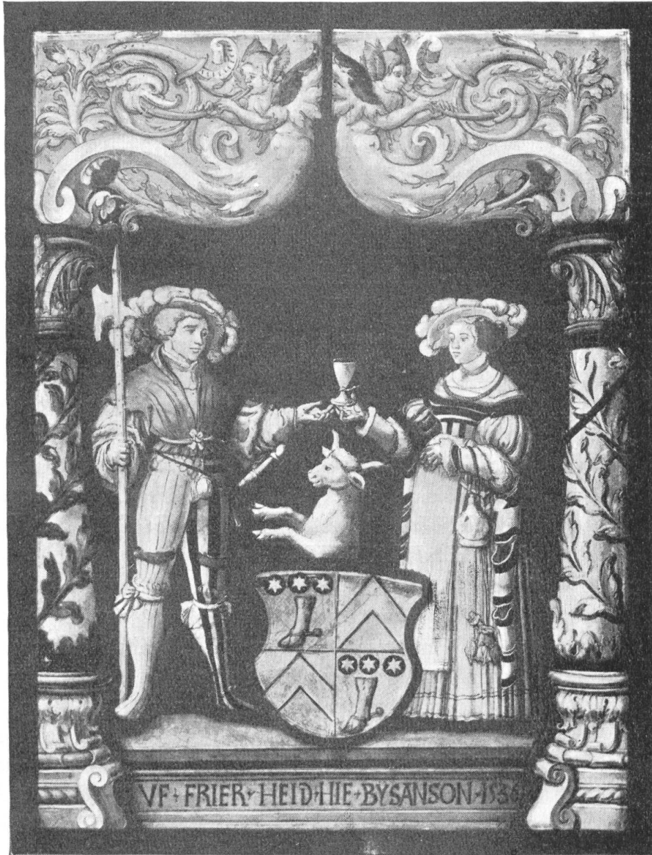
Fig. 73. Vitrail au musée du Palais St-Pierre à Lyon.

Guillaume Cheseaux avait acheté le 27 avril 1545 la seigneurie de Villaranon près de Romont, de Charles de Bonvillard 1) . Il eut un fils, son homonyme, et il est