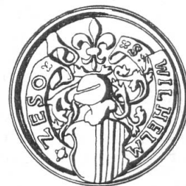
Fig. 70. Sceau de Guill. Chesaux, 1544.

On parle de lui en 1522, lors d'une expédition projetée en Lombardie 5) , et dans les affaires plutôt louches concernant la levée de quelques milliers de troupes, que l'on prétendait mener en Picardie, pour les diriger ensuite vers Genève 6) . Un de ses compagnons se plaint que Chesaux, après avoir proposé une expédition dans la vallée d'Aoste, aurait tout trahi 7) . En 1526 Fribourg le députa avec Guglen-