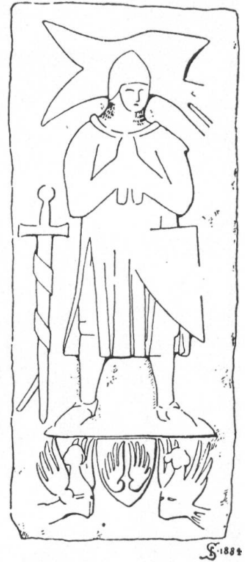
Fig. 121. Grabplatte des Ritters Conrad Kämmerer von Basel, ca. 1344.