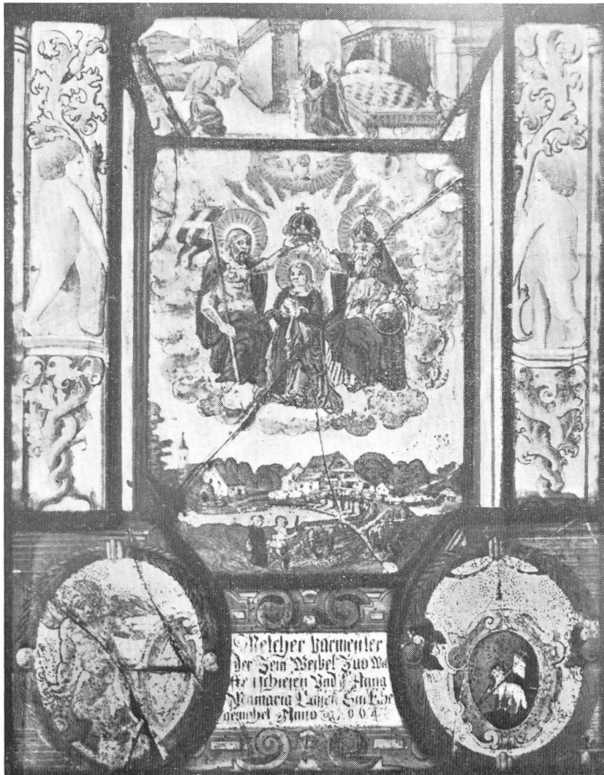
Scheibe des Melchior Barmettler, 1664.