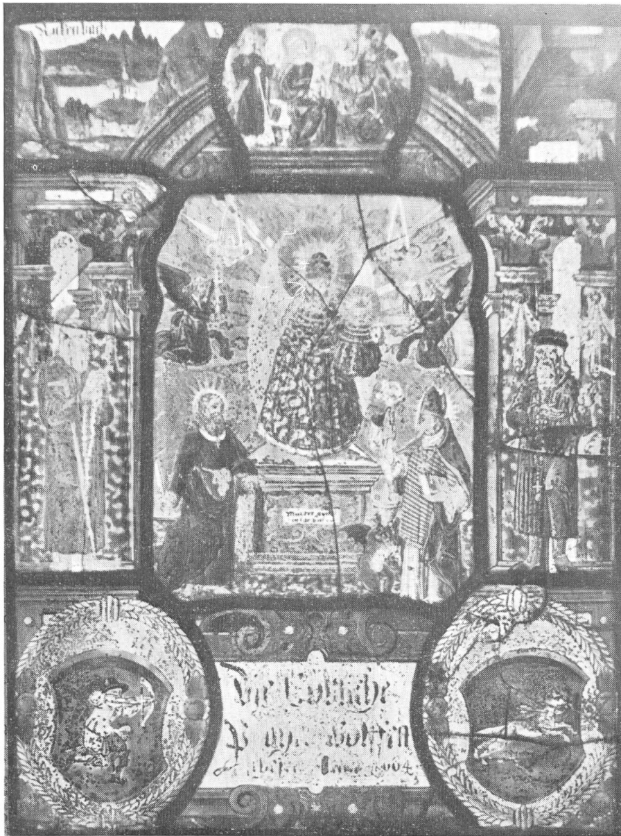
Scheibe der Pfarrei Wolfenschiessen, 1664. (Temple Ewell Church.)