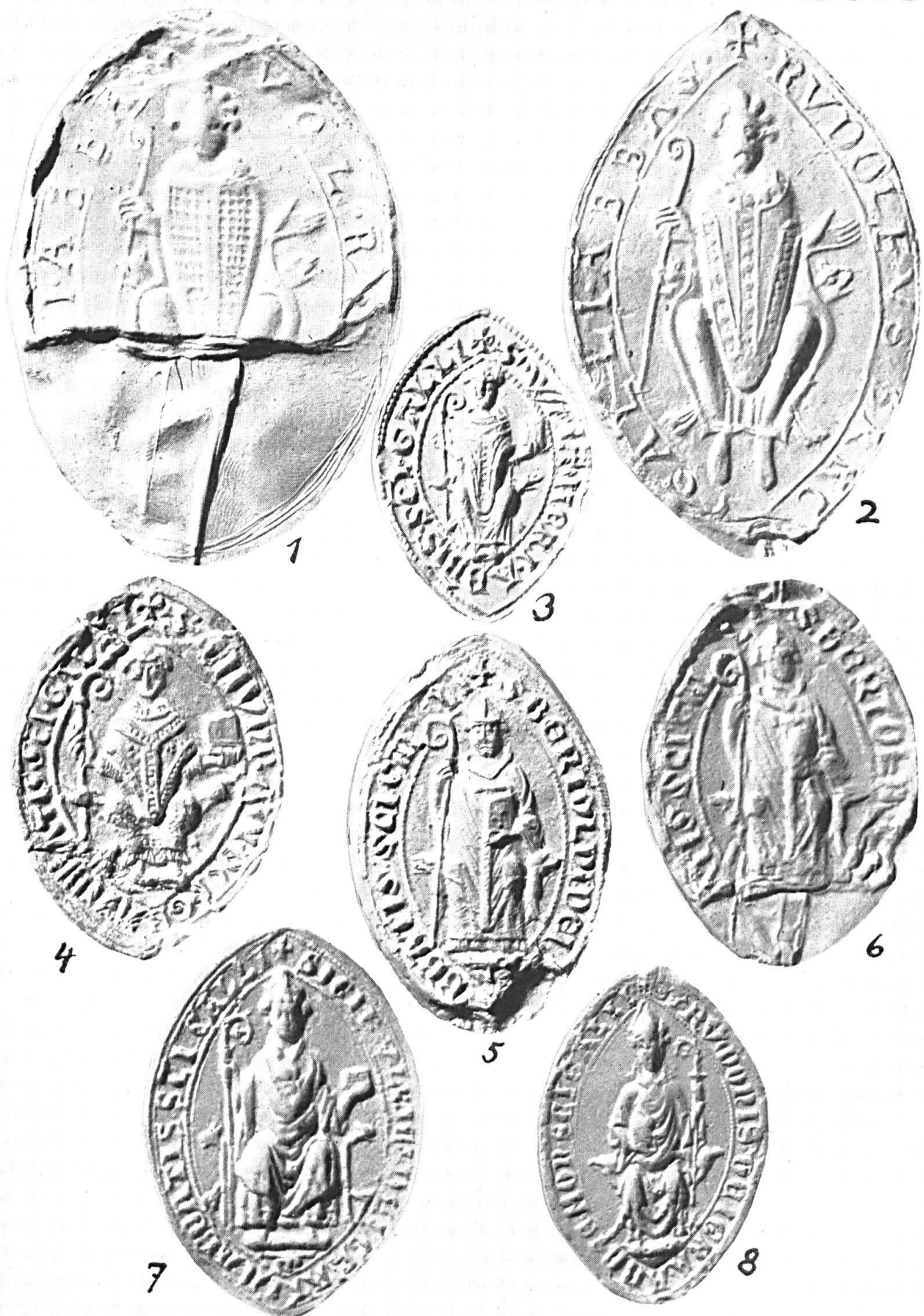
Die Siegel der Fürstbäbte von St. Gallen, I.

1. Ulrich VI. von Sax, 1204-20. — 2. Rudolf I. von Güttingen, 1220-26. — 3. Walter von Trauchburg, 1239-44. — 4. Konrad von Bussnang, 1226-39. — 5 und 6. Berchtold von Falkenstein, 1244-72. — 7. Ulrich VII. von Güttingen, 1272-77. — 8. Rumo von Ramstein, 1274-81.