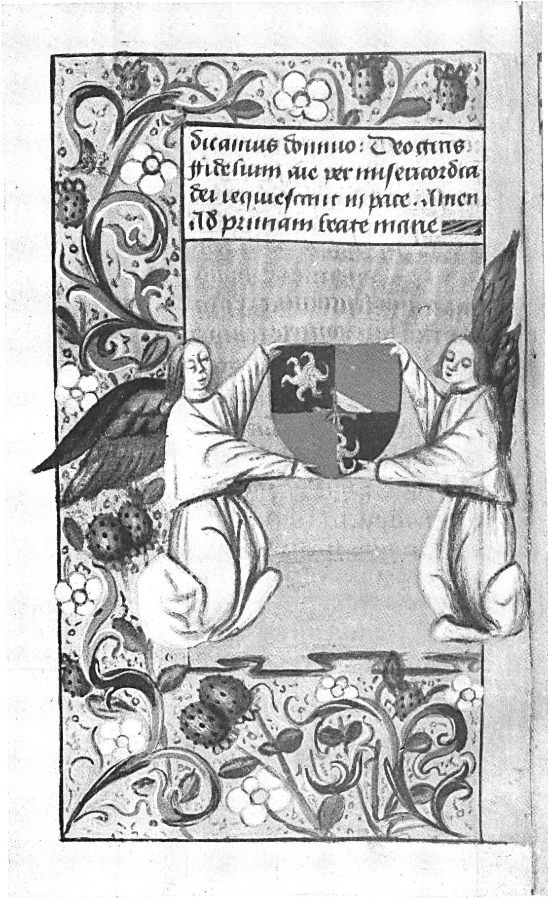
Miniature tiré du Livre d'Heures Savaron-du Peschier, vers 1536.