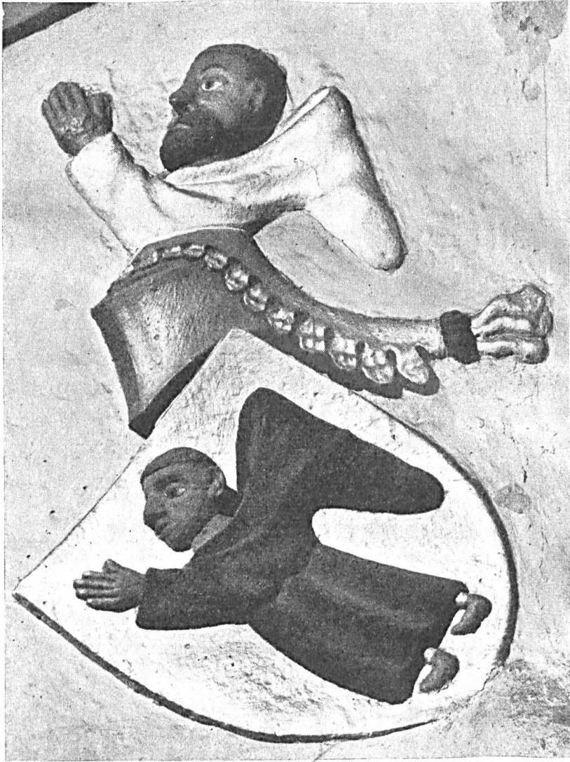
Fig. 80. Wappen des Hartmann Münch als Propst zu St. Peter in Basel.

Basels Politik war nun, diese fremde Invasion zu beseitigen und dem Hochstift zur Wiedererlangung seiner Lande beizustehen, um diese dann früher oder später zur Stadt ziehen zu können. Als im Jahre 1418 Bischof Humbert von Neuenburg auf seinem Schloss zu Delsberg starb, ermannte sich das Hochstift zur Opposition gegen den burgundischen Einfluss. Die Wahl des betagten Erzpriesters Hartmann