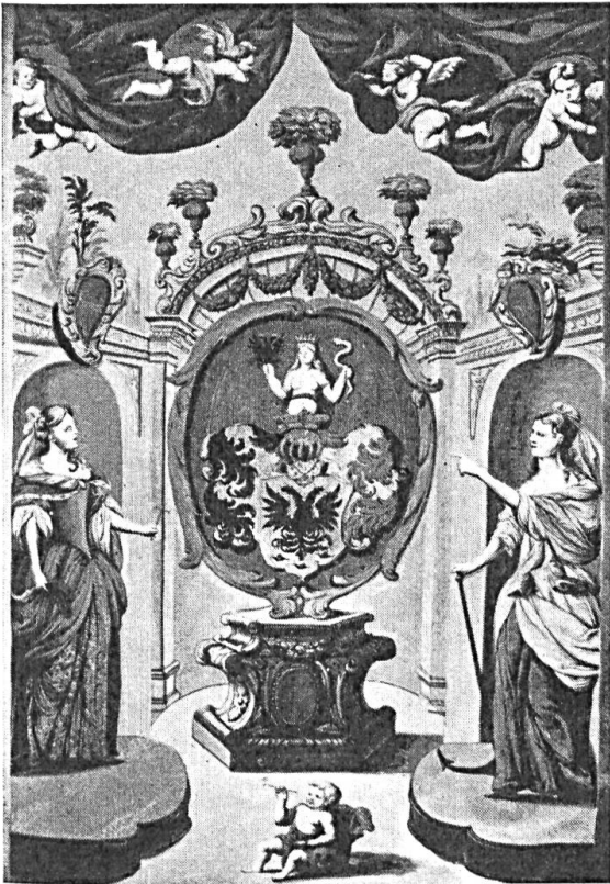
Fig. 74. Wappen der Lumaga im Wappenbuch der Stadt Wien (1675). ✓