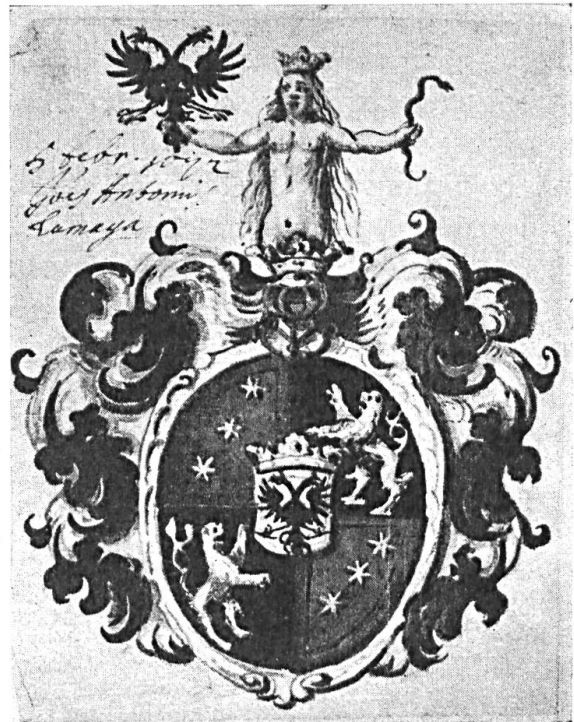
Fig. 75. Wappen des Adelsbriefes von 1672.