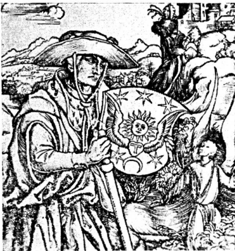
Fig. 25. Wappen des Pilgrims auf den Titelholzschnitten der Werke Gersons.

Sein Vater wurde gewöhnlich «Bürki» zubenannt. Gelegentlich wird für den Abt auch der Name seiner Mutter Ritter, miles, gebraucht. Er wurde als Magister der freien Künste an der Pariser Hochschule zum Abt erkoren, bevor er noch