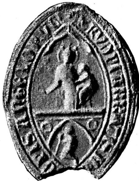
Fig. 23. Siegel des Abtes Rudolf II von Stühlingen, 1378.

sprechendes Wappen der Wolfenschiessen : In Grün ein roter Wolf, schräglinks durchbohrt von einem silbernen Pfeil . Kl. : Der wachsende rote Wolf mit grünem Drachenkamm, mit und ohne Pfeil.