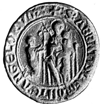
Fig. 21. Siegel des Abtes Heinrich II, 1266.

hochverdient um Wissenschaft und Kunst. Die Schreiber- und Malerschule verdankt ihm ihre Hochblüte.