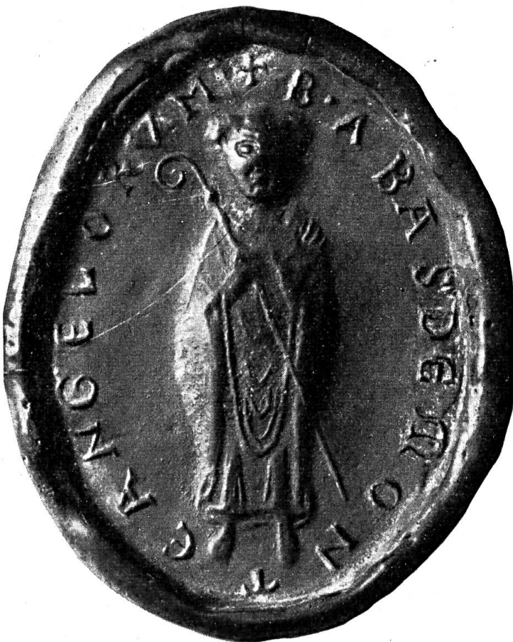
Fig. 20. Siegel des Abtes Berchtold, 1190.

Die Chronik rühmt ihn als keusch und fromm, streng gegen sich selbst, gerecht gegen die andern und als besondern Verehrer Unserer Lieben Frau. Er machte sich