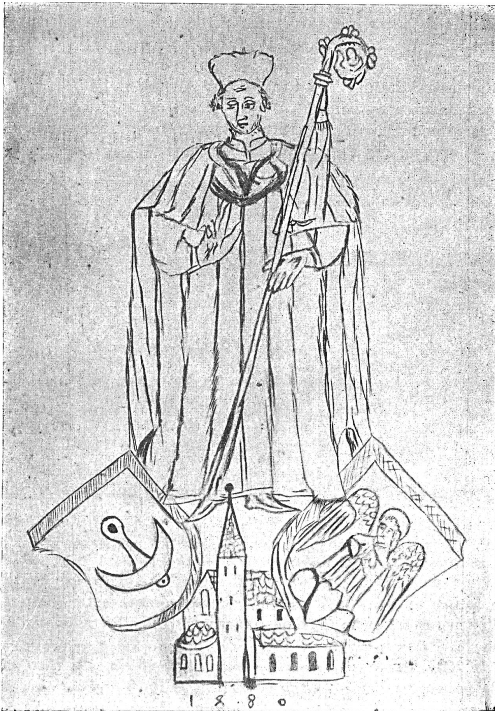
Fig. 24. Exlibris des Abtes Ulrich II. Stalder. 1480.

26. Nikolaus II. Gratis (1489-1490), vorher Mönch im rheinpfälzischen Kloster Hornbach.