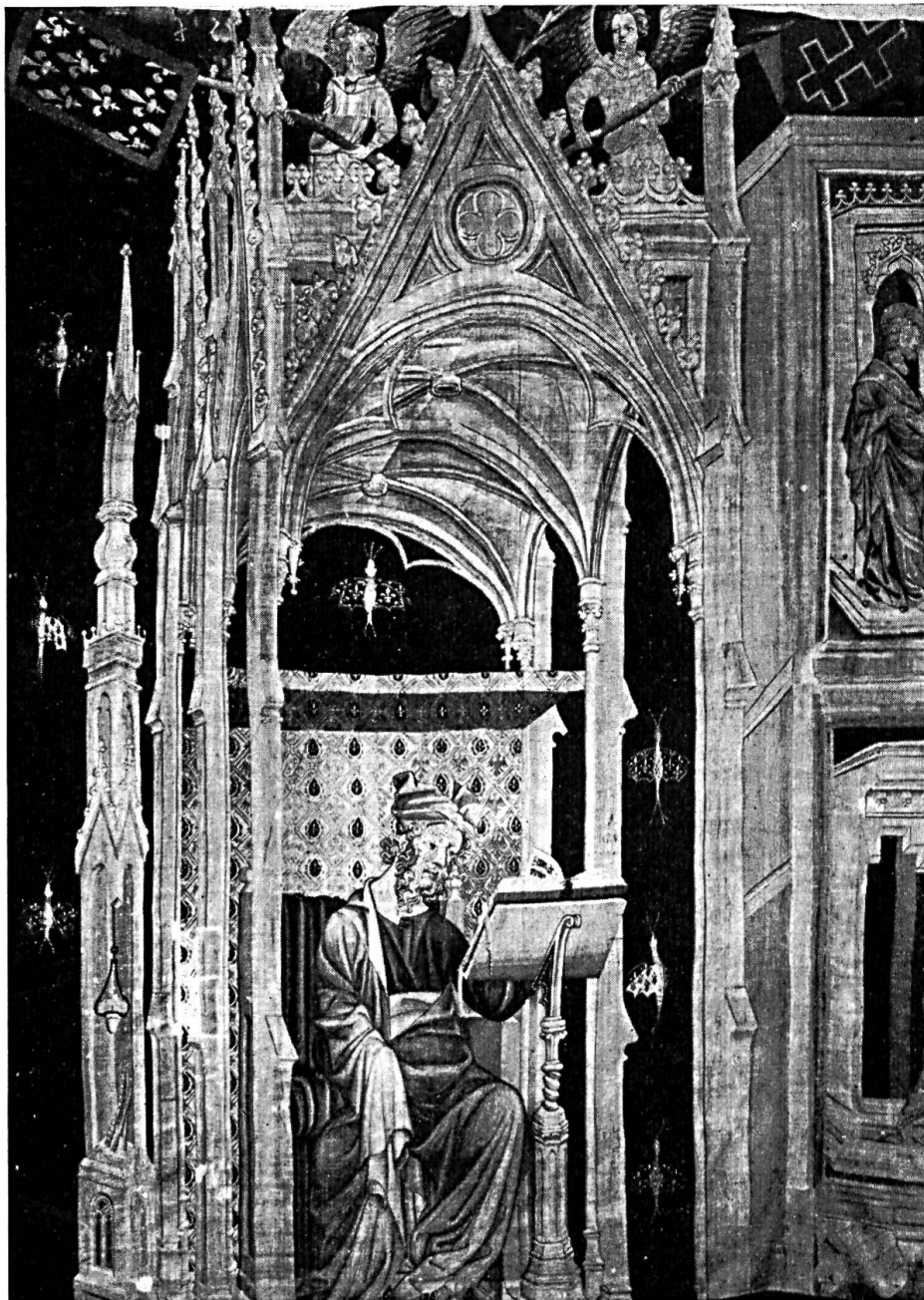
Fig. 97. Une des tapisseries d'Angers.

Tapisseries et héraldique. La « Kunsthalle » de Bâle a pu, grâce à l'amabilité des autorités françaises, exposer au début de l'année une partie des magnifiques tapisseries de l'Apocalypse d'Angers. Ces tapisseries ont été faites pour le duc Louis I d'Anjou, sur les cartons de Hennequin de Bruges, par Nicolas Bataille, lissier parisien, à la fin du XIV e siècle. Elles sont donc les plus anciennes tapisseries connues de pareille qualité. Si nous