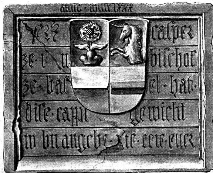
Fig. 98. Skulptur im Kreuzgang des Basler Münsters.

Im Kreuzgang des Basler Münsters findet sich, in die Brüstung des östlichen Geviertflügels eingelassen, eine ziemlich verwitterte Wappentafel, deren Schild und Inschrift schlecht beleuchtet und kaum zu entziffern sind. Es zeigt sich ganz offensichtlich, dass das schmucke kleine Kunstwerk nicht für die Stelle geschaffen wurde, an der es sich heute befindet. Dies bestätigt uns denn auch eine, aus Ver-