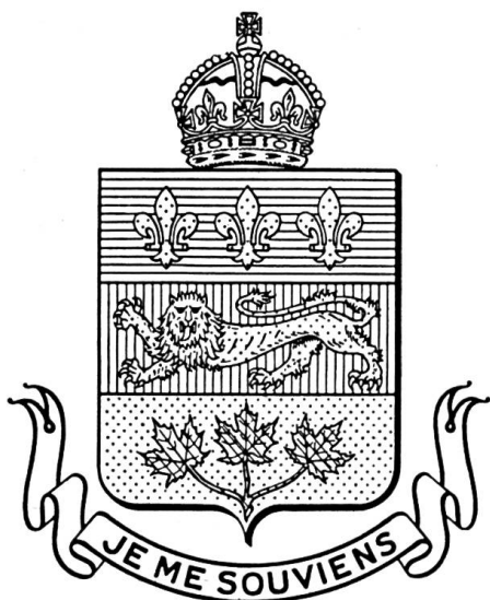
Fig. 116. Armoiries de la Ville de Québec.

entre 2 fleurs-de-lis d'or, en pointe d'un léopard d'or.