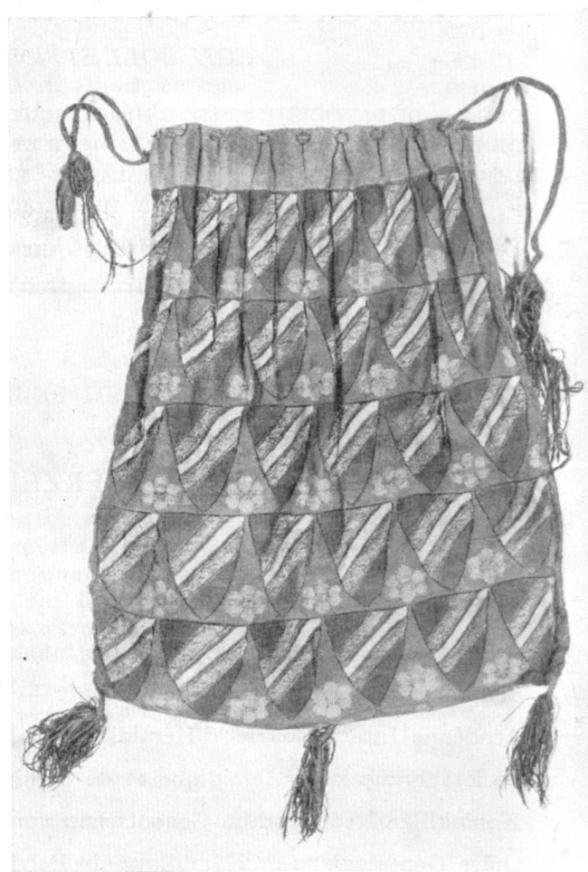
Fig. 38 et 39. Sachel aux armes des comtes de Champagne. ✓

(Birch, Scx Brit. Museum 17.984, lat. 17.097) et Blanche de Navarre, sa femme, un contre-sceau à la bande (DD 571). Thibaud le Grand († 1253) s'arme soit de deux cotices (1223 C.C.), soit d'une bande coticée (1223-1234: DD 573, lat. 17.097) et en contre-sceau, une bande. Ses fils abandonnent définitivement la bande simple qu'ils accompagnent de cotices (1259/1267 DD 11.375 11.377, CB 12). Henri III († 1274) porte les mêmes armes brisées d'un lambel du vivant de son frère (DD 586), puis pleines en 1271 (DD 11.379).