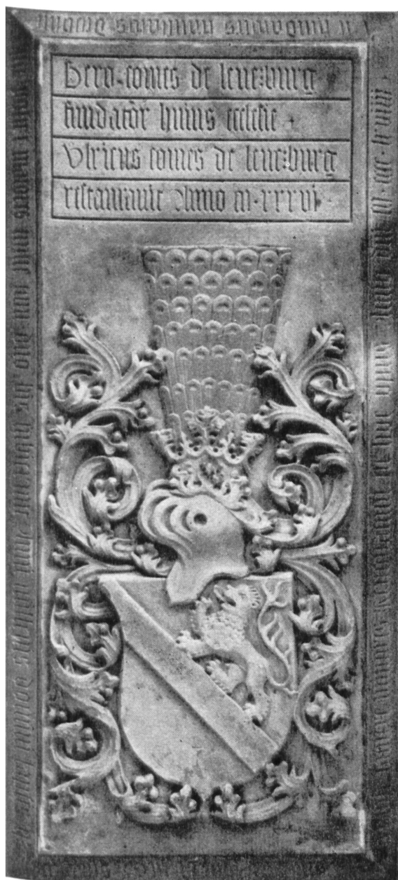
Fig. 22. Grabmalplatte der Lenzburger von 1469 (Stiftskirche Beromünster).