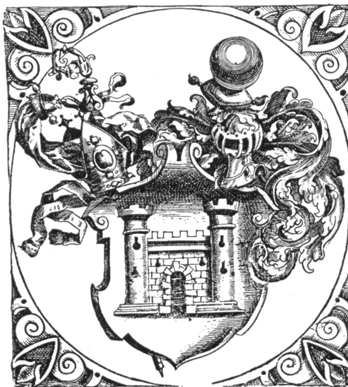
Fig. 23. Wappen des Einsiedlers Fürstabtes Werner I. von Lenzburg ( Annales Heremi , 1610).

Störung ihrer Grabesruhe in Folge kriegerischer Wirren im Chor der Stiftskirche St. Michael nun friedlich ihrer Auferstehung harren (Fig. 22). Den Löwenschild des grossen Flachreliefs des Epitaphs überragt ein gekrönter Bügelhelm mit dem habsburgischen Pfauenstutz als Kleinod. Dieser Schild darf aber nicht als das Wappen der Grafen von Lenzburg angesprochen werden. Schon 1897 erklärte ihn Theodor von Liebenau als der Wappengruppe der Kiburger zugehörig. Das gräfliche Geschlecht erlosch mit Ulrich IV. 1173. Aus der Blütezeit der Lenzburger ist uns kein Wappen überliefert. Wo später solche benötigt wurden, stossen wir auf drei Schildfiguren :