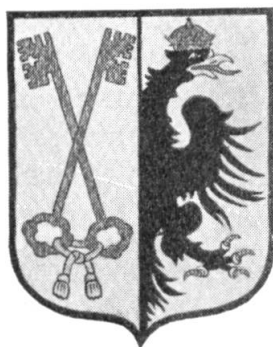
Abb. 2. Wappen der Stadt Moûtiers.