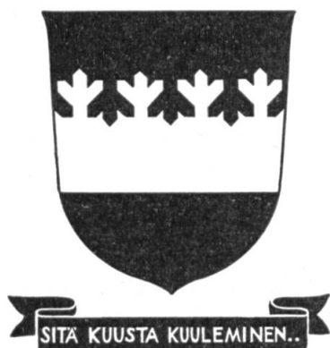
Fig. 4. Armoiries de M. Uhro Kekkonen, président de la République de Finlande.

Un nouveau trait de partition. — Les manuels d'héraldique contiennent un grand nombre de traits de partition — on pourrait dire un trop grand nombre — et il semble assez inutile d'en inventer de nouveaux. Faisons cependant une exception pour un trait de partition inventé par notre membre Gustaf von Numers, Helsinki, Finlande. Ce trait qui représente des branches de sapin stylisées symbolise dans les blasons finnois les grandes forêts dont le pays est si riche. Quatre communes finnoises ont déjà adopté — avec l'autorisation du gouvernement — des armoiries aux traits de sapin. La dernière est Joutsa, qui porte de gueules à la champagne d'argent formée d'un trait de sapin, surmontée d'un arc