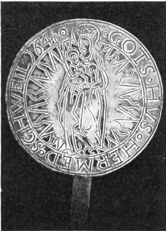
Abb. 1. Bretzeleisen des Klosters Hermetschwil 1640.