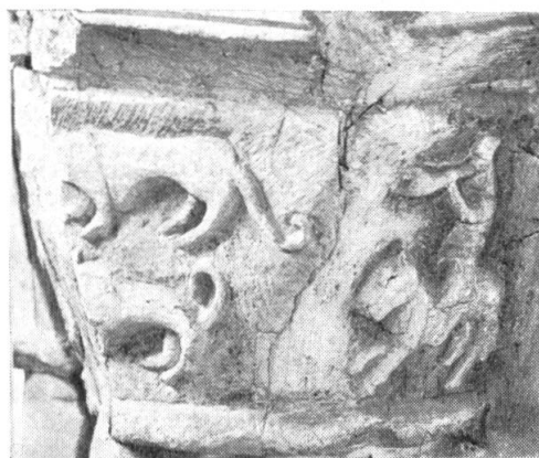
Fig. 3. — Falaise. — Eglise St-Gervais. Chapiteau roman: Triptyque de la « Scène de chasse ». Volet central: « aux deux animaux superposés », et volet droit: « au cavalier chasseur et sonneur d'oliphant ».