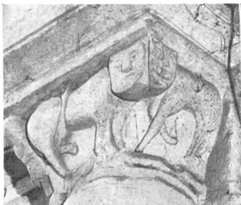
Fig. 4. — Falaise. — Eglise St-Gervais. Le véritable chapiteau roman au léopard.

Signalé par M. l'Abbé de LA RUE, M. LAMBERT et M. A. CANEL, ce symbole offre de curieuses particularités. La position accolée des deux têtes fait penser au lion à double-corps qui figure sur le cinquième pilier de la même église (RENÉ HERVAL, Falaise , p. 161). Cf. GALBREATH, Manuel du Blason , p. 116, fig. 240 : deux lions d'or à une seule tête.