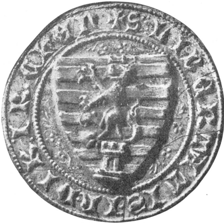
Fig. 7. Sceau de la Ville de Diekirch.

Il s'agit de la matrice en cuivre, de forme ronde, 46 mm de diamètre, propriété de la ville de Diekirch. On situe son origine dans le III e quart du XIV e siècle. L'écu, aux armes de la ville, est ici burelé de 12 pièces, au lion rampant armé, couronné et accompagné d'une tour ajourée à trois créneaux mouvante de la pointe de l'écu. Légende (capitales gothiques) : + S. LIBERTATIS - IN - DIKIRCHEN +. On remarque que le nombre des burelles est différent de celui des armes que nous connaissons habituellement. Notre éminent compatriote M. Jules Vannérus avait, en son temps, préconisé d'adopter pour Diekirch d'or à six fasces d'azur , alors que notre président a toujours conseillé le burelé d'or et d'azur (de 10 pièces) , au lion rampant d'argent, armé, lampassé de gueules et couronné de même, accompagné d'une tour à trois créneaux de gueules, ajourée et maçonnée de sable et mouvante de la pointe de l'écu. On s'est finalement rallié à ce choix. Diekirch ayant été,