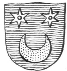
Fig. 6. Wappen Collioud.

Das Allianzwappen über dem Portal ist leider nicht mehr zu retten; die Wappenbilder bröckeln ab und wären nur durch eine Kopie zu ersetzen. Die hübschen Skulpturen der Galerie waren lange Zeit mit graublauer Ölfarbe übermalt. Diese an und für sich hässliche Behandlung hat die Wappen jedoch vor der Verwitterung gerettet. Sie konnten gereinigt und mit einem neuen Anstrich, der Tingierung der Wappen entsprechend, versehen werden. So werden sie der Nachwelt erhalten bleiben und von einer glanzvollen Epoche des schönen Lehensschlosschens in Coppet zeugen.