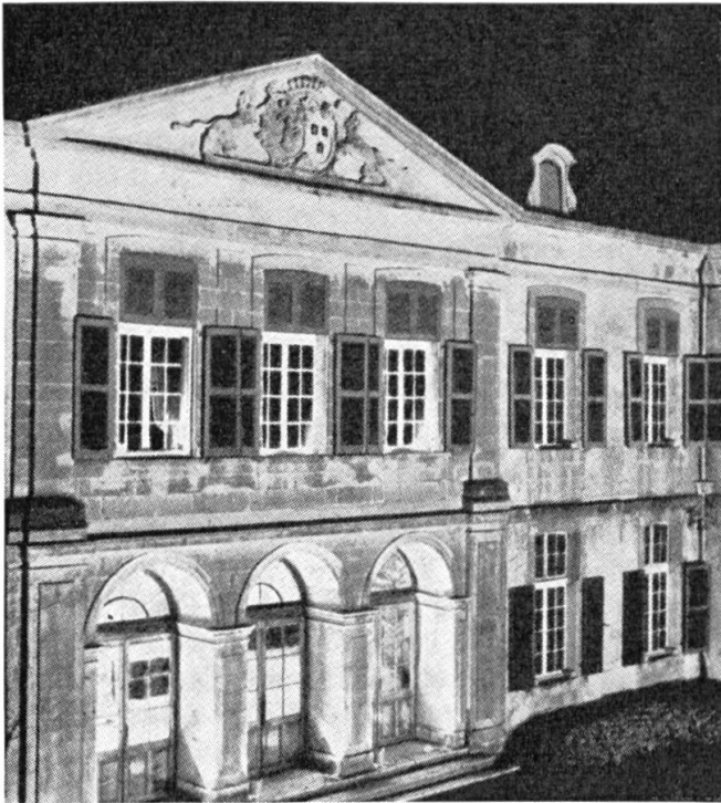
Fig. 5. Allianzwappen Smeth-Kunkler von Schloss Coppet.