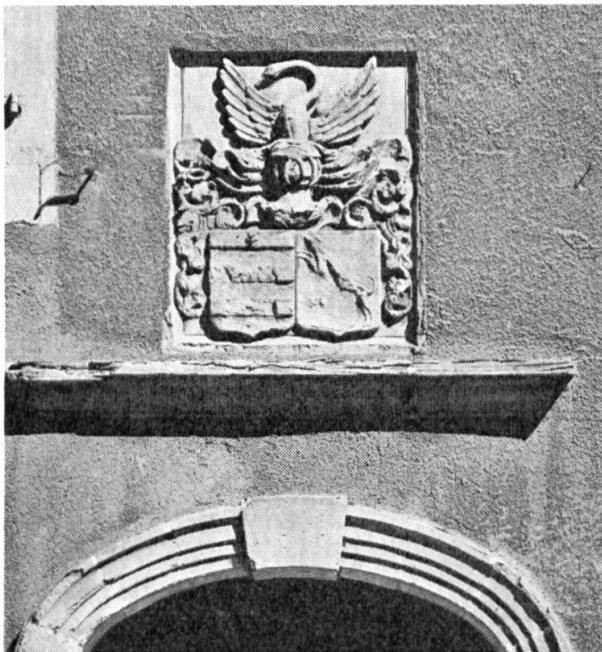
Fig. 2. Portal der «Tour de Mézières» in Coppet mit Allianzwappen Quisard-Chasseur.

Dem aufmerksamen Spaziergänger unter den Arkaden des Städtchens Coppet entgeht eine Sandsteinskulptur wohl kaum, die über dem Portal eines grossen Hauses der Seeseite angebracht ist (fig. 2). Sie stellt ein Allianzwappen dar, das leider den Weg aller Arbeiten in diesem anfälligen Material geht und langsam bis zur Unkenntlichkeit abbröckelt. Es ist deshalb wohl angezeigt, sich näher mit diesem heraldischen Monument zu befassen und es in Wort und Bild festzuhalten.