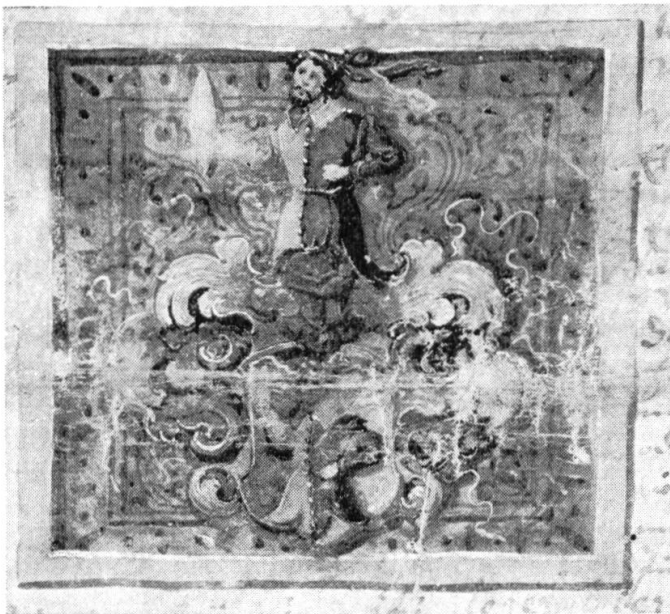
Abb. 1. Wappen Kast, 1642.