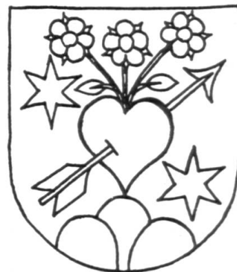
Abb. 6. Der jüngere Schild.

Das Wappen ist in einer grossen Anzahl und vielen Varianten überliefert und verrät, dass manche Schilde von ihren Trägern als rein persönliche Abzeichen benützt wurden. Einige