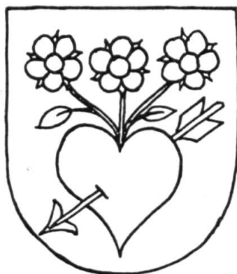
Abb. 5. Der ältere Schild.