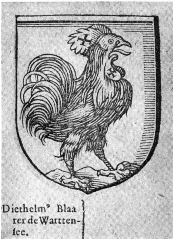
Abb. 3. Wappen Blarer v. Wartensee

der Benedictinerorden in Deutschland im XVII. Jahrhundert aufzuweisen hatte » sei.