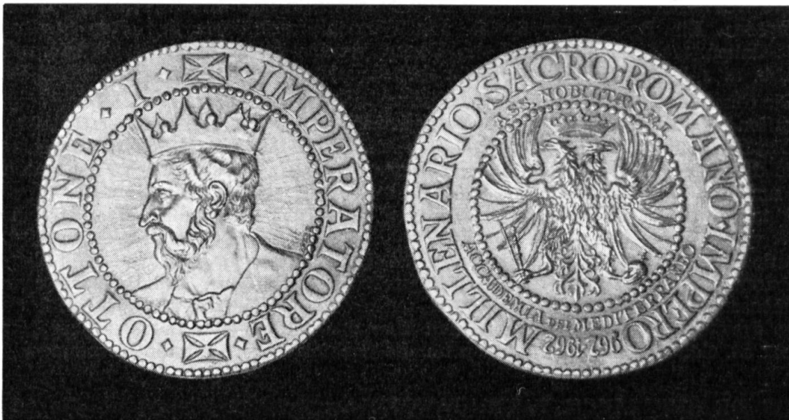
Fig. 1. Medaglia commemorativa del Congresso.