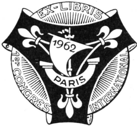
Fig. 3. Emblème du Congrès.