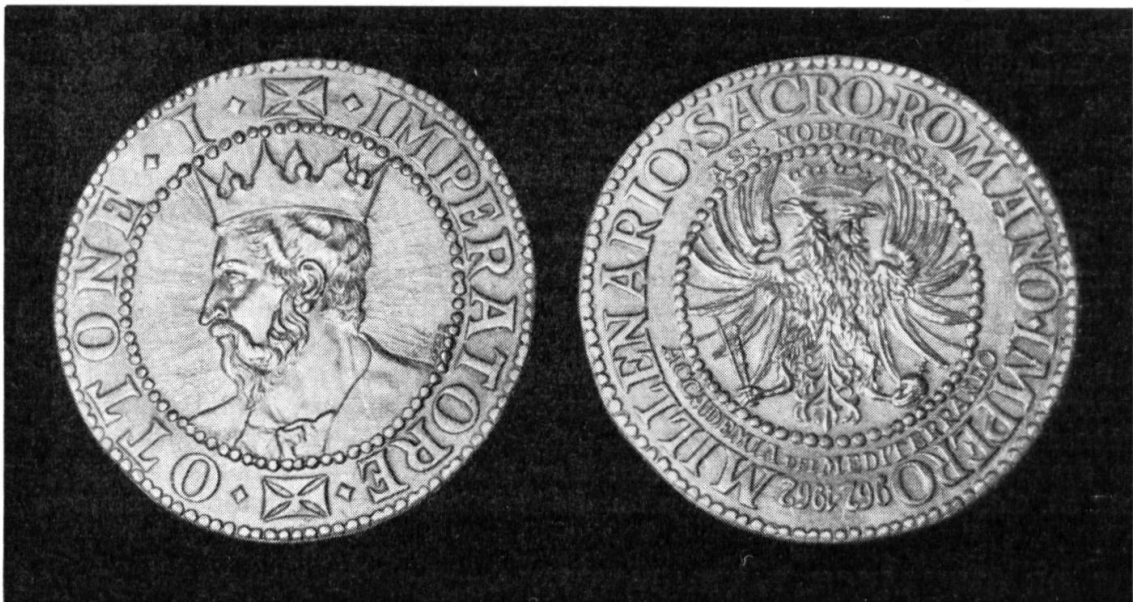
Fig. 1. Medaglia commemorativa del Congresso.