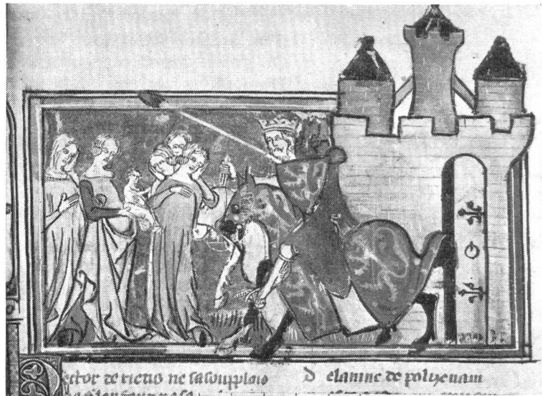
Fig. 2. Le départ d'Hector.