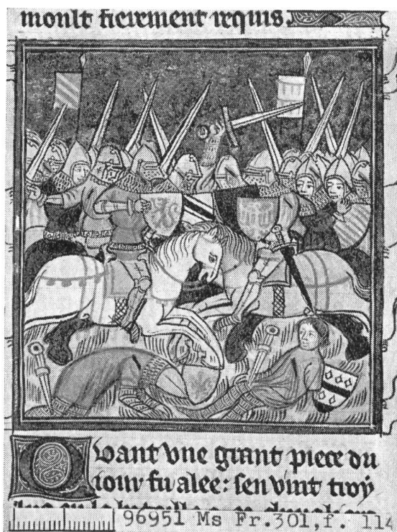
Fig. 5. Une mêlée.

Sur ce processus d'élaboration des armoiries (qui permet un nouvel abord du problème de leur origine), il semble que méritait d'être recueilli le précieux témoignage d'un contemporain, tel que Benoit de Sainte Maure, écrivant pour l'élite d'une société qui était alors la plus civilisée de l'Europe occidentale.