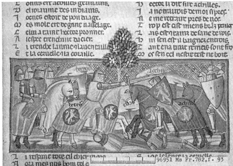
Fig. 3. Le combat d'Achille et d'Hector.

Benoit de Sainte Maure montre fort bien la transformation en train de s'opérer: Achille porte déjà bouclier armorié, mais garde encore un gonfanon rouge uni; par contre, Hector arbore même