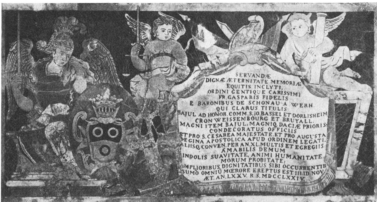
Fig. 7. Tombe du commandeur de Schönau

Il y a des raretés parmi des dalles. Sur la tombe du bailli de Fleurigny est représenté le combat naval qu'il a gagné sur les Turcs. C'est la reproduction d'une des petites gouaches qui illustraient les exploits des marins de l'Ordre, exécutée avec une grande minutie. Les tenants sont deux images d'esclaves turcs. Sur la tombe du chevalier Lopez (fig. 4), obscur Espagnol mort en 1795, la Renommée, coiffée du casque du porte-étendard de l'Ordre, pleure sur une urne. Et cette urne est un vase grec rouge à figures noires, grandeur nature. Or, ces vases grecs n'avaient attiré l'attention des érudits et des collectionneurs que depuis peu de temps : l'un des premiers spécialistes avait été William Hamilton (plus tard, Sir William Hamilton), ministre d'Angleterre à Naples. C'était seulement aux alentours de 1780, avec le renouveau de l'intérêt porté à la Grèce, que l'on avait commencé à étudier les vases trouvés en Campanie. Les chevaliers de Malte en général, et Lopez en