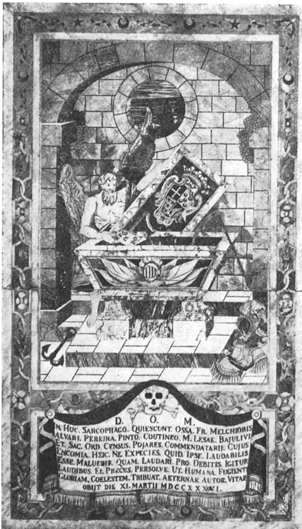
Fig. 1. Tombe du commandeur Pinto Coutinho

térêt, pour l'histoire du blason, ainsi que pour l'histoire tout court. Il est relativement facile de se faire une idée de ces dalles : elles ont toutes été reproduites dans l'admirable ouvrage de Sir HANNIBAL SCICLUNA, The Church of St John in Valetta , publié à Rome en 1956. Il est impossible