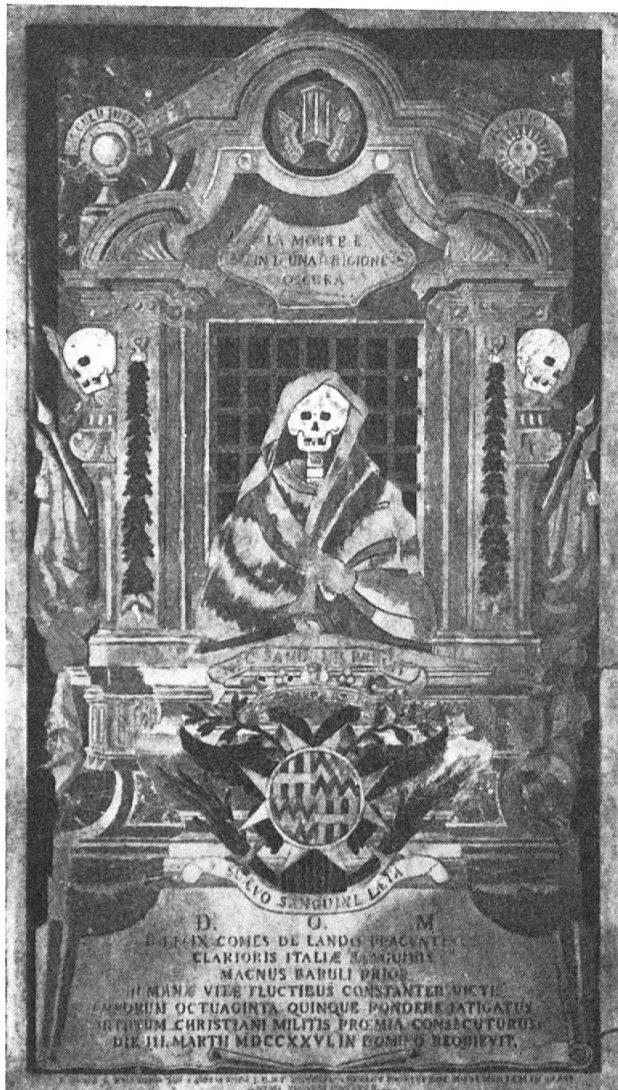
Fig. 6. Tombe du commandeur de Lando

( Requiescat in Domino ). Au-dessus du sarcophage se dresse un mur percé d'une fenêtre ronde à travers laquelle on aperçoit la mer et des rochers.