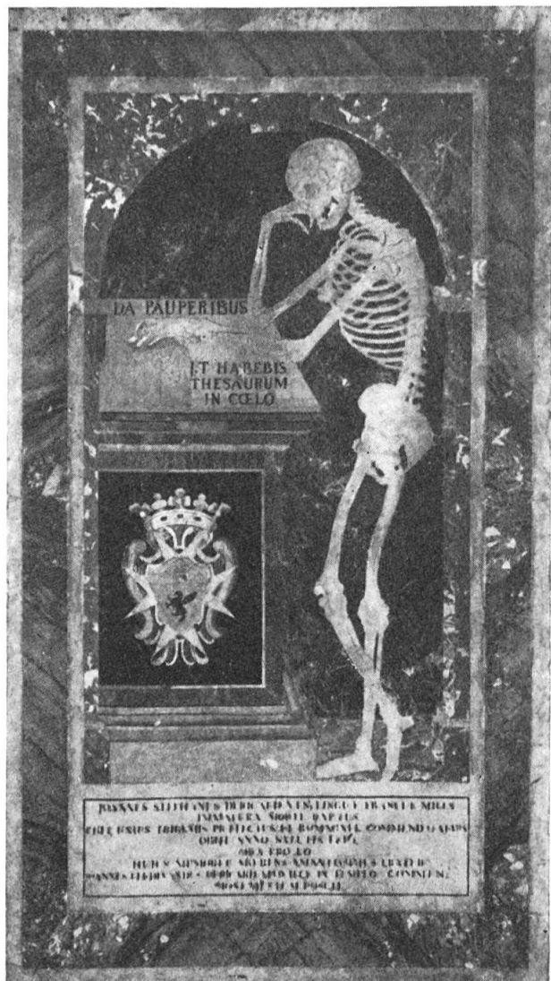
Fig. 2. Tombe du bailli de Ricard