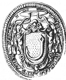
Fig. 2. Sceau de J.-B. d'Angeloch, 1616.

Bodmer, de Baden, fut baptisé à Überlingen le 21 octobre 1586; élève du Collège germanique de Rome, ordonné prêtre en 1610, évêque in partibus de Chrysopolis en Asie mineure, il est nommé en 1629 suffragant de l'évêque de Bâle. Chanoine de Saint-Ursanne, il mourut le 6 avril 1646 à Saint-Ursanne où il semble avoir passé une bonne partie de son existence.