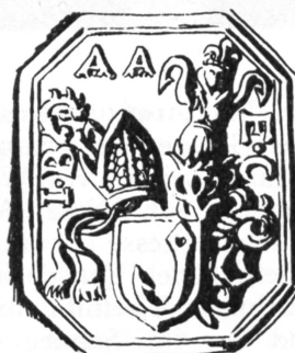
Fig. 3. Sceau de J.-B. d'Angeloch, 1633.