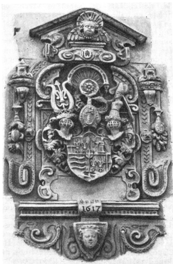
Abb. 1. Wappen des Jakob Fugger, Fürstbischof von Konstanz, 1617

Das Bistumswappen von Konstanz (gleichfalls das durchgehende rote Kreuz in silbernem Felde) findet sich in der vorliegenden Wappenplastik im kleinen Herzschild, mit dem das geviertete Wappen belegt ist. Jakob Fugger weicht in der Wappenführung ab von den Konstanzer Fürstbischöfen, die zumeist das Konstanzer Kreuz in das erste und vierte Feld stellten. Schliesslich findet sich im