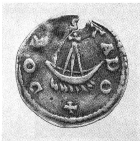
Abb. 2. Karl der Grosse. Dorestad.