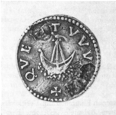
Abb. 1. Karl der Grosse. Quentowik.