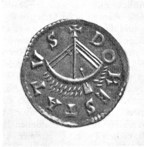
Abb. 3. Ludwig der Fromme. Dorestad.

(Abb. 1). Die Vorderseite zeigt die nach rechts gerichtete Büste des Kaisers mit der Umschrift: KAROLVS IMP(erator) AVG(ustus), die Rückseite ein Schiff und die Umschrift: QVENTVVVIC 7 . Ähnliche Schiffsmünzen Karls des Grossen und Ludwigs des Frommen sind seit langem bekannt. Sie stammen aus den beiden Münzstätten Dorestad und Quentowik (Abb. 2 und 3). Im Ostseeraum sind sie mehrfach nachgeprägt worden.