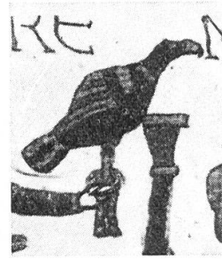
Abb. 5. Teppich von Bayeux ca. 1070.

schlossenen Flügeln. Zum Vergleich seien nur zwei Beispiele gebracht. Das erste (Abb. 5) zeigt einen Falken aus der Bildfolge des Teppichs von Bayeux aus der Zeit um 1070, das zweite (Abb. 6) den Adler von dem stabförmigen Zepter Ottos III. auf dem Bild des Bamberger Evangeliiars aus der Zeit um das Jahr 1000 12 . In beiden Fällen finden wir dieselbe S-förmig geschwungene Form wie auf der Münze von Quentowik.