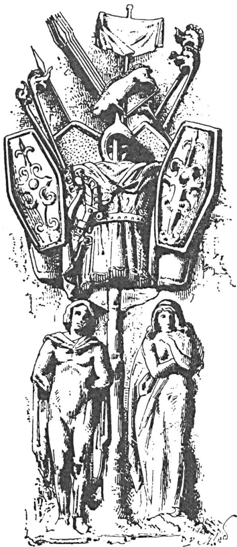
Fig. 3. Arc de triomphe d'Orange . Rais d'escarboucle à quatre rais fleurdelysés. Les branches latérales ont été tronquées, en raison de l'étroitesse des boucliers en losange. (DURUY, Histoire des Romains , t. II, p. 71).

occupe un emplacement en rapport avec ses caractères et conforme à la légende de la Pierre du dragon , le nasal :