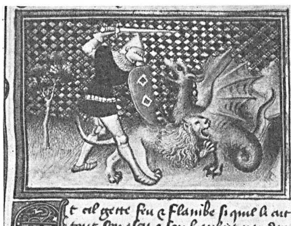
Fig. 7. Combat de Perceval, allié du lion, contre le dragon (Ecole française, vers 1400-1420). L'écu aux mâcles .

notion, et le symbolisme de nombreux documents médiévaux ne s'expliquerait pas sans elle.