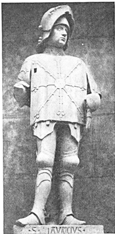
Fig. 4. Aix-en-Provence. Retable dit de la Tarasque, en raison du dragon de sainte Marguerite, qui y figure (1470). S'opposant à ce dernier, le rais d'escarboucle brille sur la cotte d'armes de saint Maurice. On remarquera les nœuds , sur le trajet des rayons. (Musée des monuments français, La sculpture, salle XVII) Guide éd. 1953, p. 39).

effet, qui éclaire parfaitement notre sujet : celle de « conservation de la force magico-vitale » (p. 146).