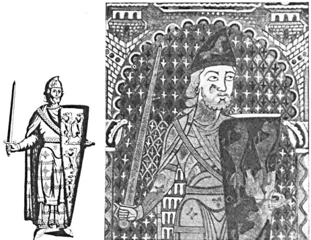
Fig. 2. Le rais d'escarboucle à quatre rais de Geoffroy Plantagenêt (émail du Mans) vers 1150. En raison de son importance pour le sujet qui nous occupe, nous redonnons cette figure connue. A droite, l'original. A gauche, la reproduction — assez infidèle — qu'en a publié MONTFAUCON, Monuments de la monarchie française . Les branches verticales du rais d'escarboucle manquent, dans cette reproduction. On y a omis également d'évider les carrés posés sur leurs pointes, dans l'élément horizontal représenté. Il apparaît comme un simple renforcement de l'écu. Ne disons rien des panthères métamorphosées en lions. Cette question a été traitée ailleurs. En toile de fond, sur l'original, l'on remarquera le Grand filet . Au centre de chaque claire-voie, une fleur de lys symbolise la lumière-créatrice. La polarisation de cette force est indiquée par l'alternance, claire et foncée, des fleurs. Cf. fig. 6, sur le manteau des rois de France, une disposition analogue du Grand filet et des fleurs de lys.

M. Metman nous écrivait : « J'ai l'impression, que le mot boucle n'est pas toujours pris dans le même sens par les différents poètes. » C'est exactement ce que nous remarquons plus haut, en en donnant le pourquoi. Il reste à examiner ces différents points et à montrer comment une gerbe de symboles, ou plutôt les aspects divers d'une même notion, retrouveront leur unité dans l'expression héraldique des meubles qui en dérivent : le rais d'escarboucle et les mâcles . Ces dernières ne représentent finalement, en application