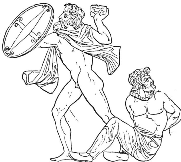
Fig. 10. « Nos pères, les Gaulois » combattaient nus, pour mieux vaincre l'ennemi, grâce à leur rayonnement. Mais une figure rayonnante à quatre rais rappelait également, sur leurs boucliers, les vertus de cette force. Les Templiers, qui usèrent si souvent du rais d'escarboucle (voir la fresque du Vieux-Pouzauges, Vendée, et nombre de leurs sceaux ou emblèmes), ont aussi utilisé une croix simple, tantôt pattée, tantôt quelque peu ancrée, qui rappelle beaucoup celle des Gaulois. (La figure ci-dessus est extraite de DURUY, Histoire des Romains , t. I, p. 242. Voir également SAGLIO, Dictionnaire des antiquités grecques et romaines , t. 5, p. 488, fig. 7091).

lois » ne se montrèrent pas différents des autres et, peut-être, le premier qui s'avisait de l'insuffisance d'une telle méthode, tout en acceptant d'y remédier en se protégeant d'une cuirasse, n'entendit pas pour autant renoncer aux avantages des croyances anciennes. Il crut conserver la puissance offensive de son rayonnement — véritable force atomique avant la lettre — en peignant tout simplement sur son bouclier un schéma de celle-ci. C'est l'origine des figures dont l'arc de triomphe d'Orange nous garde le témoignage (fig. 3).