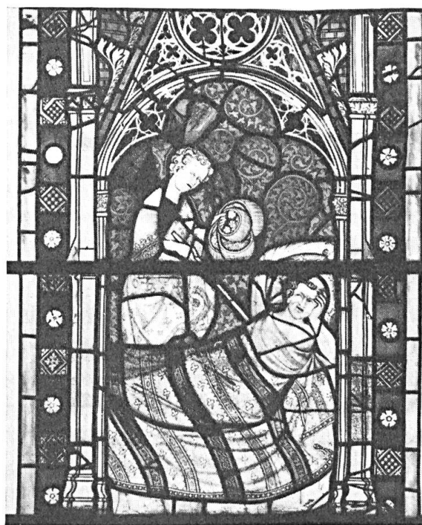
Fig. 8. Le vitrail de Saint-Ouen de Rouen : Gamaliel apparaît au prêtre Lucius (vers 1345).

Cette dernière conviendrait moins encore au vêtement de Gamaliel. Cette lu-