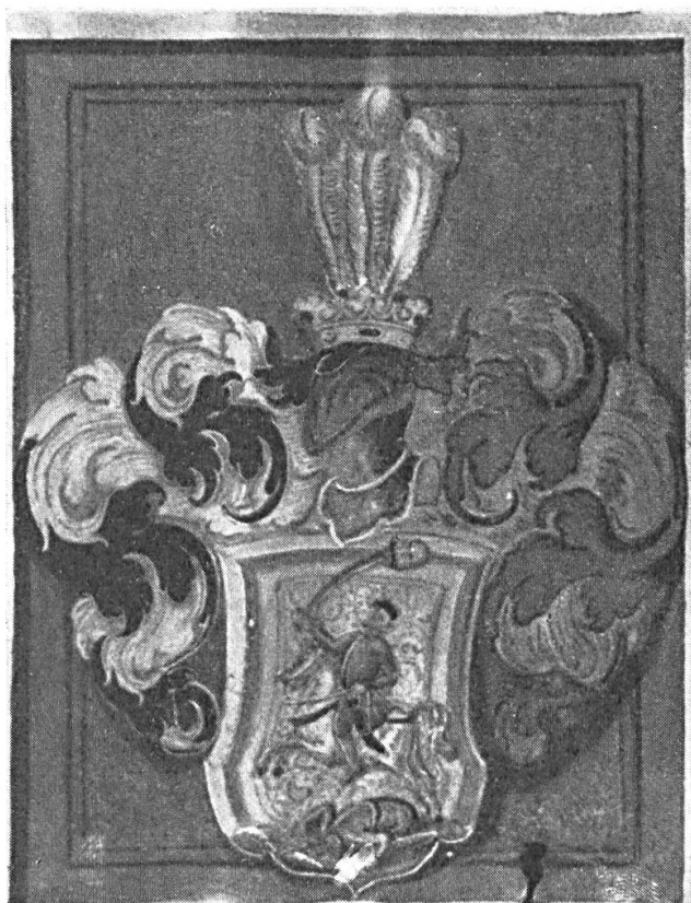
Fig. 5. Armoiries octroyées à Georges DÉVAY de Felenyed, à Gyulafehérvár (aujourd'hui : Alba Julia, Roumanie), le 29 juillet 1599 par le cardinal André Báthory, prince de Transylvanie. D'après l'original conservé aux ANH, fonds du chapitre de Gyulafehérvár, N° 2. Publiées par Sebestyén József : Báthori András czímerlevelei (lettres armoirées octroyées par André Báthory), in « Genealógiai Füzetek », t. V. Kolozsvár, 1907, p. 65.

sur l'épée du vainqueur qui se tient debout ou à cheval (fig. 5). Il peut aussi arriver que la monture piétine le gisant, image cruelle mais correspondant, sans nul doute, à des cas vécus.