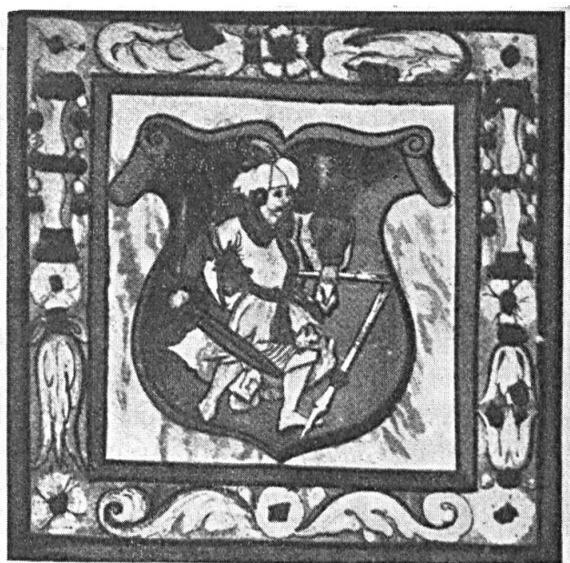
Fig. 9. Armoiries octroyées à Pierre DÉVAY, à Segesvár (aujourd'hui : Sighisoara, Roumanie), le 13 juillet 1538, par Jean I er de Szapolya, roi de Hongrie. D'après un cliché de l'original, jadis conservé aux archives des comtes Wrzna à Holleschau (Moravie), détruites lors d'un incendie en 1914/18. Publiées par Ed. Gaston Gf. Pottich von Pettenegg : Das Wappen der Dévay , in « Adler », N. F., t. II, Wien, 1892, p. 112-114.

dans les flots d'une rivière 2 . Dans un autre cas curieux, le blason s'inspire de l'évasion d'un preux hongrois capturé par les Turcs qui s'est sectionné la cheville à la hache pour recouvrer sa liberté chérie 3 .