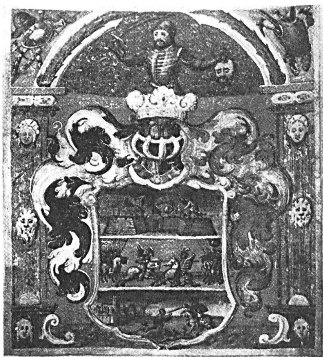
Fig. 4. Armoiries octroyées à Nicolas SEGNYEY, de Lápispatak, à Kassa (aujourd'hui : Kosice, Tchécoslovaquie), le 1 er mai 1606, par Etienne Bocskai, prince de Transylvanie. D'après l'original conservé aux Archives des comtes Károlyi à Budapest. Publiées par Géresi Kálmán : A nagy-károlyi gróf Károlyi család oklevéltára (cartulaire des comtes Károlyi de Nagy-Károly), t. IV, Budapest, 1887, planche hors texte, entre les pages 14 et 15.