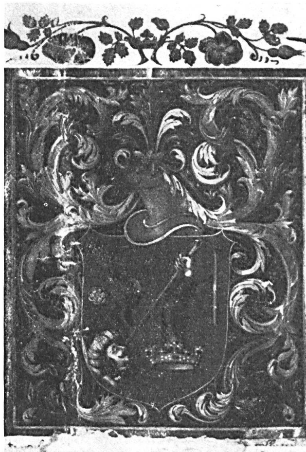
Fig. 6. Armoiries octroyées à la famille FÁNCHY, de Denna, en 1511, par Vladislas II Jagellon, roi de Hongrie. D'après un cliché pris sur l'original conservé aux Archives d'Etat tchécoslovaques pour la Moravie, à Brno. L'original égaré depuis des siècles a été découvert en 1965; la date exacte et le lieu de son octroi, ainsi que le nom de son bénéficiaire n'ont pas encore été publiés. Siebmacher : Grosses und allgemeines Wappenbuch ; Der Adel von Ungarn (ci-après : Siebmacher : Ungarn) t. V, Nürnberg, 1894, pl. 31, apporte pour les Fánchy un dessin entièrement contrefait, reproduit probablement d'après un sceau défectueux. Première publication de l'original nouvellement découvert.

En raison de sa multiplication, la tête de Turc ne tardera pas à devenir un élément si caractéristique de l'héraldique hongroise qu'on ne la blasonne plus, mise à part sa position dans l'écu. Il est entendu qu'elle est de carnation, de face ou légèrement tarée à dextre, le cou tranché net et maculé de sang, les yeux clos, des moustaches pendantes, avec ou sans barbe. Nue, elle est surmontée d'une touffe de cheveux chignonnée à la turque. On indique cependant si elle est coiffée d'un turban (de gueules et bordé de blanc