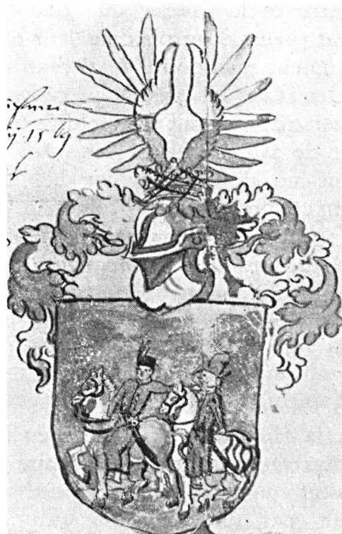
Fig. 10. Dessin du projet ayant servi par la suite à l'octroi d'armoiries à Pierre NAGY, à Vienne, le 14 mai 1569, par Maximilian, roi de Hongrie (Maximilian II, empereur). D'après le projet original attaché aux lettres armoriées sur lesquelles le quartier réservé au miniature héraldique est resté vide. Les deux documents se trouvent conservés aux ANH, fonds des lettres armoriées autrefois au Musée national hongrois. Texte publié par Áldásy : Címereslevelek , t. I, Budapest, 1904, p. 50-51.

de la voile verte des hadji . Une source encore inépuisée se dégage, somme toute, de ces documents concernant certains aspects de la civilisation turque des XVI e et XVII e siècles, dont les détails sont d'autant plus difficiles à saisir qu'en Turquie même toute représentation figurative est interdite par le Coran. Les renseignements graphiques puisés à Venise et en Iran pourront être complétés à cet égard par l'apport encore inexploité des peintres héraldistes en Hongrie.