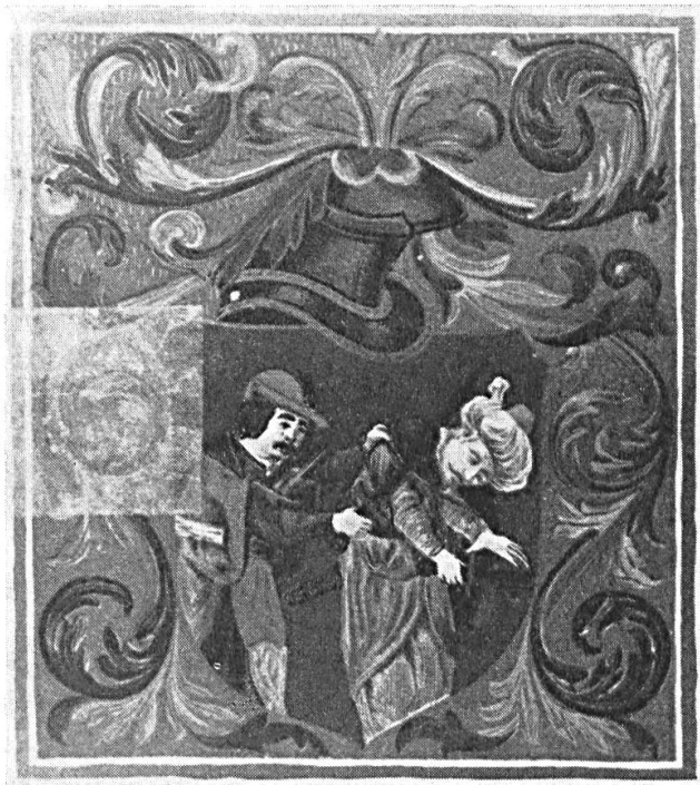
Fig. 2. Armoiries octroyées à Jean DOMBAY de Ivánczfalva, à Bude, le 1 er août 1506, par Vladislas II Jagellon, roi de Hongrie. D'après l'original conservé autrefois aux archives privées des Dombay à Nyitra (aujourd'hui : Nitra, Tchécoslovaquie), dispersées en 1945. Publiées dans les Mon. Hung. Her. , t. I., Budapest, 1901, planche hors texte entre les pages 86 et 87.

La promotion sociale ne connaissait, par ailleurs, aucun préjugé ethnique. On