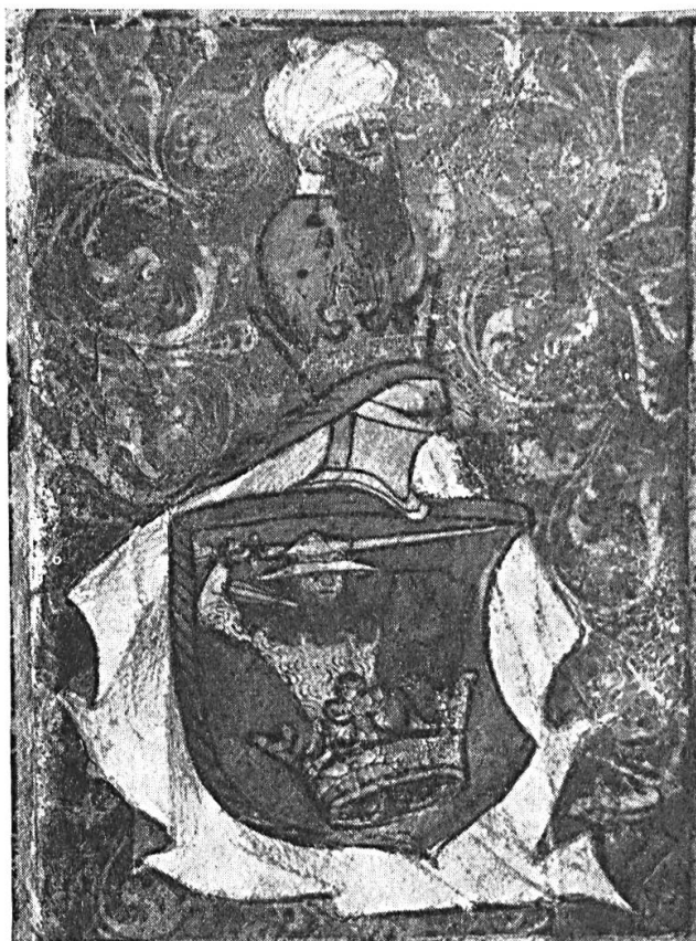
Fig. 1. Armoiries octroyées à Pierre BEREKSZÓI, à Torda (aujourd'hui : Turda, Roumanie), le 10 février 1448, par Jean de Hunyade, régent de Hongrie. D'après l'original conservé à la Bibliothèque de l'Université de Kolozsvár (Cluj, Roumanie). Publiées dans les Monumenta Hungariae Heraldica (ci-après : Mon. Hung. Her. ), t. I, Budapest, 1901, planche hors texte entre les pages 70 et 71.

Si, du point de vue héraldique, le procédé n'est peut-être pas irréprochable, cette exubérance d'un naturalisme excessif fait, malgré tout, la joie de l'historien qui retrouve le parfum de l'« événement