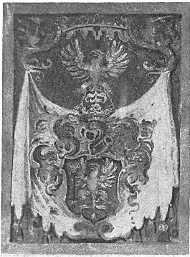
Fig. 7. Armoiries octroyées à Jean WOYNOVITH dit Horváth, à Prague, le 20 juillet 1569 par Rodolphe, roi de Hongrie (Rodolphe II, empereur). D'après l'original conservé aux ANH, section des archives de famille Horváth de Zalabér. Première publication.

boliques ou réels : couronne de lauriers ou étendard conquis, etc. Le vainqueur est parfois remplacé, selon la coutume héraldique hongroise, par un symbole de vaillance : lion, griffon, aigle, léopard ou licorne (fig. 7).