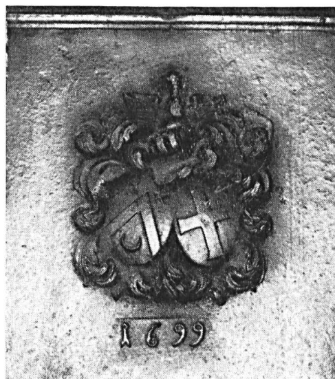
Fig. 6. Indéterminé, 1699.