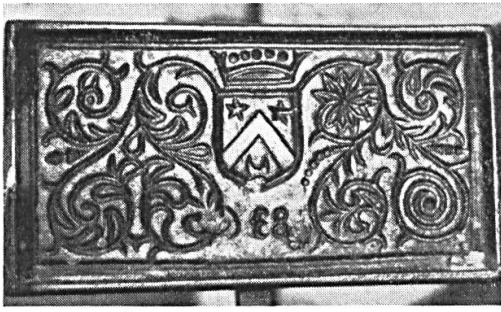
Fig. 7. Indéterminé, 1638 ?

Deux écus ovales accolés par leur sommet, le premier portant de... au chevron de..., accompagné en chef de deux étoiles de... et en pointe d'un croissant de...; le second portant de... à la croix pattée alésée de... Timbre : un casque fermé posé de profil avec ses lambrequins entourant les deux écus. Cimier : une aigle éployée de... Sous les écus la date 1699.