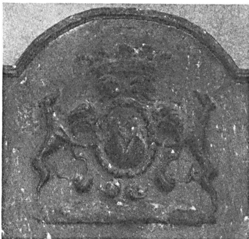
Fig. 4. de Vaudrey, XVIII e siècle.

La maison de Vaudrey, l'une des plus anciennes et des plus prolifiques du Comté de Bourgogne, a formé plusieurs branches, dont