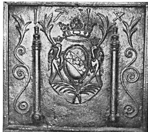
Fig. 9. Indéterminé, 1714.

Entre deux colonnes, un écu ovale portant : de... à la bande de... chargée de trois