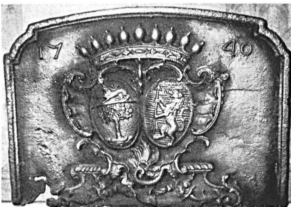
Fig. 8. Chomereau de Saint-André-Mayret, 1740.

Dans un cartouche surmonté d'une couronne de comte, deux écus ovales, le premier portant de... à l'arbre de... sur une terrasse de..., au chef d'azur, au lion passant de...; le second portant d'azur au lion couronné de... tenant une flèche de... Aux deux angles supérieurs de la plaque la date 1740.